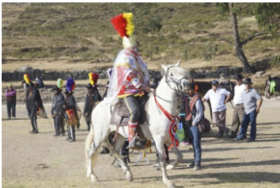
El desafío del moro

Vélez crea este drama que sitúa hacia el año 800, cuando la ciudad de Roma es asediada por el rey lombardo Desiderio, quien se jacta de ser el más cruel e inhumano de los infieles. Ante esto se reúnen el rey Carlomagno y varios de los pares: su sobrino Roldán (antes de Roncesvalles), Reinaldos de Montalbán, el guerrero español Íñigo Arista (quien solía pelear siempre al lado del rey francés) y, finalmente también, Bernardo del Carpio, en nombre del rey español Alfonso el Casto. Es Bernardo quien mata al rey Desiderio, salvando a Roma del asedio de los infieles.