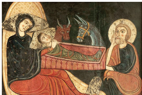
Fig. 5. Anónimo, Frontal de altar de Santa María de Aviá (detalle de La Natividad ), h. 1200. Temple sobre tabla, 107 x 177 cm, Núm. Inv.: 015784-000. Barcelona, Museo Nacional de Arte de Cataluña