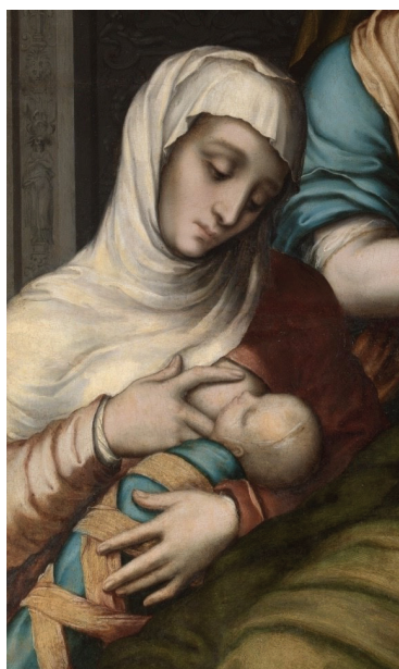
Fig. 4. Luis de Morales, El nacimiento de la Virgen (detalle), h. 1562-1567. Óleo sobre tabla, 69,2 x 93,2 cm. Núm. Inv.: P07859. Madrid, Museo del Prado