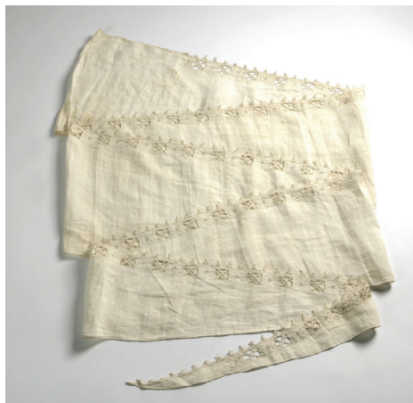
Fig. 12. Anónimo, Fajero infantil (probablemente de origen italiano), h. 1590-1600. Lino blanco adornado con puntas de cadeneta y cortadillo, 297 x 24,5 cm, Núm. Inv.: B.878-1993, Londres, Victoria and Albert Museum