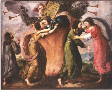
Fig 1b. Matias Greuter, Harmonia seu concordancia Decalogi , Roma, Rossi, 1653.