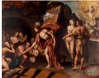
Fig. 10. Primer y quinto artículos del Símbolo de la Fe el catecismo de Belleri, 1575, en la serie de grabados de Johan Sadeler y Maarten de Vos, (1579) y en el Credo de Miguel de Santiago para la Catedral de Bogotá (c. 1690)