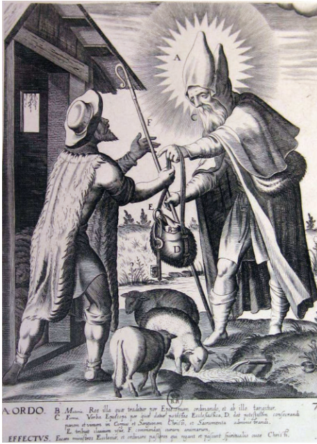
Fig. 7. Greuter, Mateus, Schemata VII Sacramentorum , Lam. VI. Sacramento del Orden