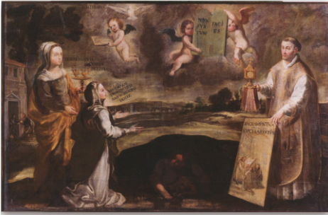
Fig 1b. Matias Greuter, Harmonia seu concordancia Decalogi , Roma, Rossi, 1653.