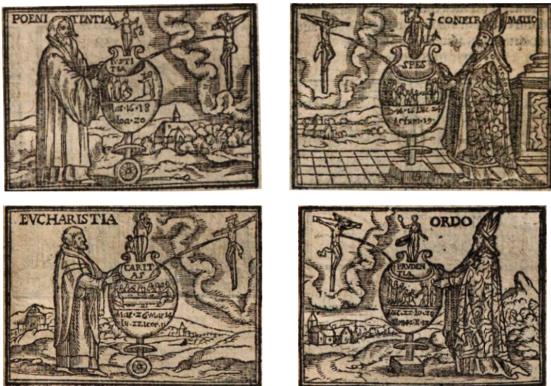
Figura 6. Grabados de sacramentos en el Canisio de Amberes, Belleri, 1575.

Dada la práctica identidad entre las obras de Miguel de Santiago y lo impreso por Greuter, el análisis iconográfico-doctrinal que hice de las primeros es igualmente válido para los segundos, por lo que no es necesario volver a repetirlo. Es suficiente con observar las imágenes para comprobarlo.