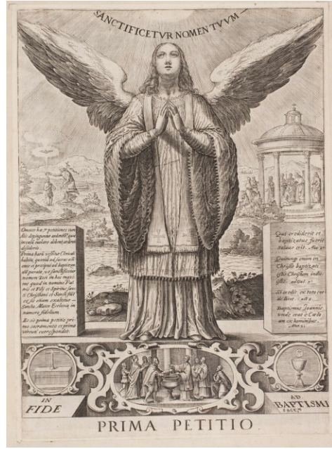
Fig. 8. Greuter, Mateus, VII Petitiones Orationis... , lam. I, Primera petición

XVI y primera del XVII, a raíz del decreto de Trento sobre las imágenes y la aparición de los catecismos tridentinos, especialmente los de Canisio 11 .