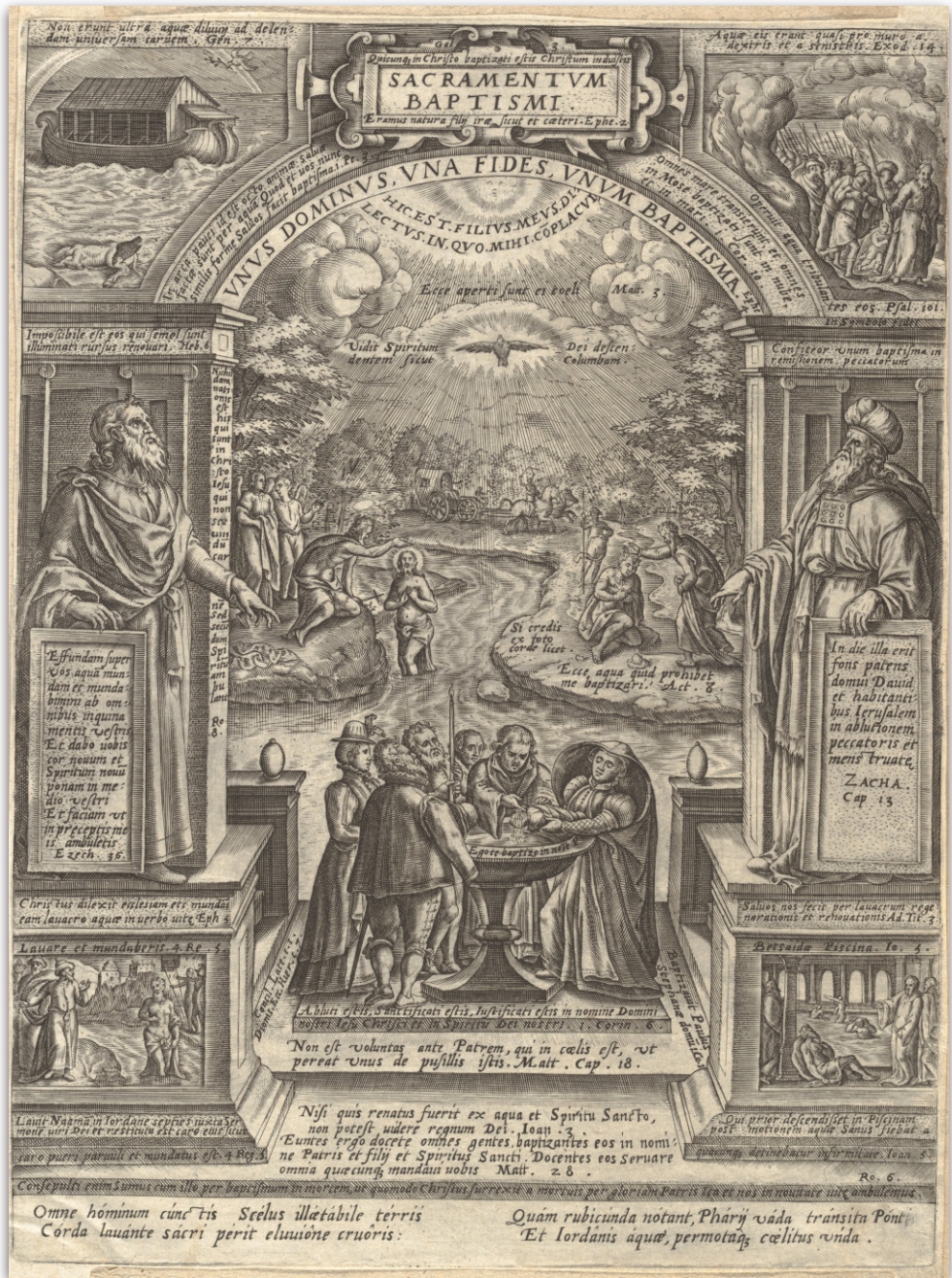
Fig. 9. Philips Galle, Sacramento del Bautismo, Amberes, 1576