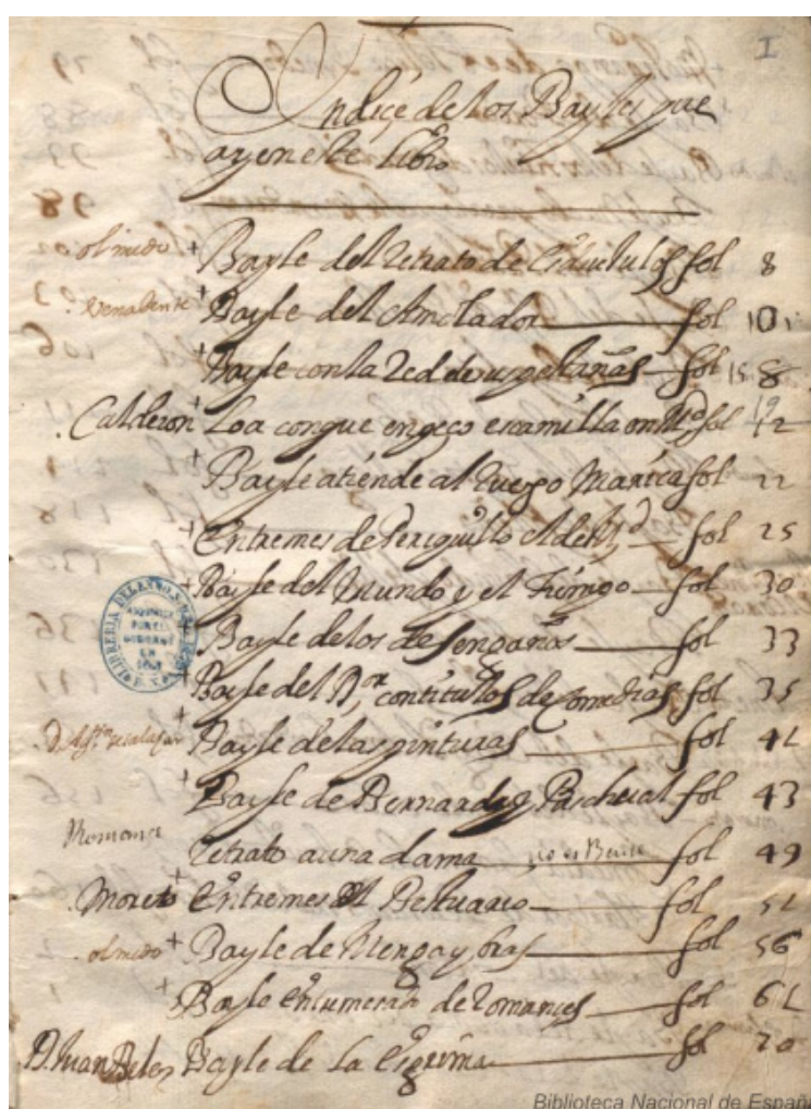
«Índice de los bailes que hay en este libro»

Nuestra loa aparece en el ms. 14.856 de la BNE 1 , que acoge en su seno hasta casi cincuenta «Bailes diferentes», catalogados debidamente en un índice que señala —en alguno de los casos— el autor al que se atribuye la obra. Veamos una muestra del índice tomada del códice: