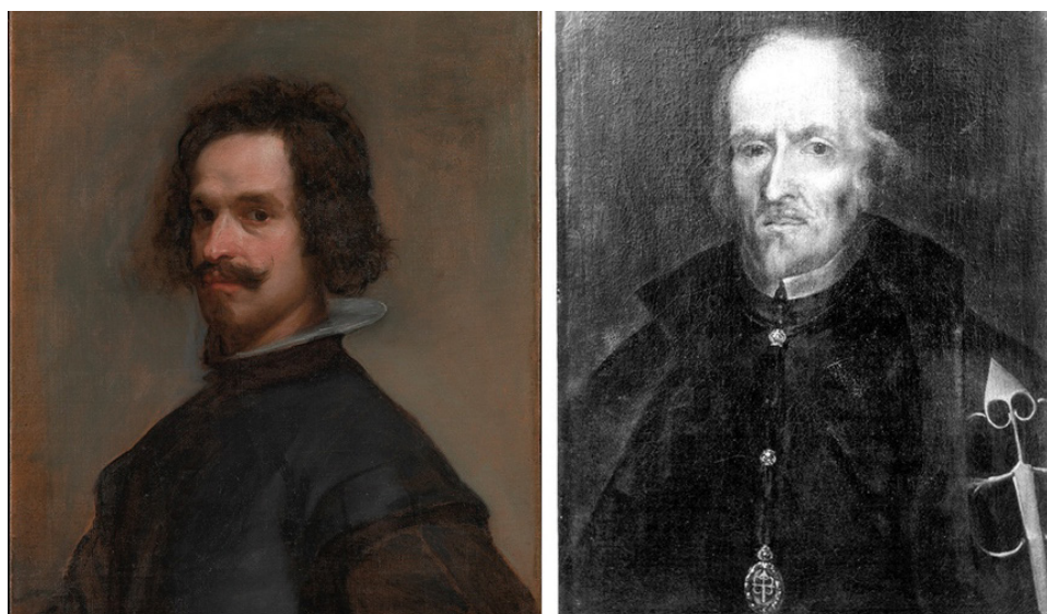
Figura 4. Comparación entre las pinturas de Velázquez, Retrato de hombre (c. 1634, Metropolitan Museum, Nueva York) y Alfaro, Retrato de Calderón (destruido en 1936; fotografía de la Fonoteca Patrimonio Histórico, Archivo Moreno, 40820B)

Por otro lado, hay varios retratos de don Pedro Calderón de la Barca, pero todos lo representan de edad avanzada. Hay que descartar como verdaderos retratos el Retrato de clérigo (Museo Lázaro Galdiano) 39 y, por comparación con los más fiables, el atribuido a Antonio de Pereda (Madrid, Colección Particular) 40 . El retrato que siempre ha sido estimado auténtico es aquel que se colocó el mismo día de su entierro sobre en su monumento fúnebre en la desaparecida Iglesia del Salvador, que según Antonio Palomino (1655-1726) pintó Juan de Alfaro (1643-1680) 41 .