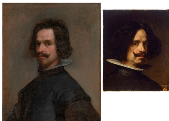
Figura 2. Velázquez. Comparación a escala de tamaño real entre dos pinturas de Velázquez, el Retrato de hombre (c. 1634, Metropolitan Museum, Nueva York) y el posible Autorretrato (1630, Museo de San Pío, Valencia)

Retrato de hombre (c. 1625. Museo del Prado, p1224) de identificación dudosa, y el Autorretrato realizado en Italia (1630. Museo de san Pío, Inv. 572) citado por Francisco Pacheco (1564-1644) 4 y del que no hay dudas 5 . Quizá sea este último, por la edad con la que se representa, el más idóneo para ser comparado con el personaje del Met o Las lanzas . Al hacerlo hay que admitir ciertas similitudes fisonómicas, pero también diferencias significativas. Velázquez era moreno y el joven del retrato del MET es de pelo castaño oscuro; la nariz del pintor es recta, la del desconocido tiene joroba nasal; a su vez hay diferencias de temperamento que resultan fáciles de dilucidar. [Fig. 2]