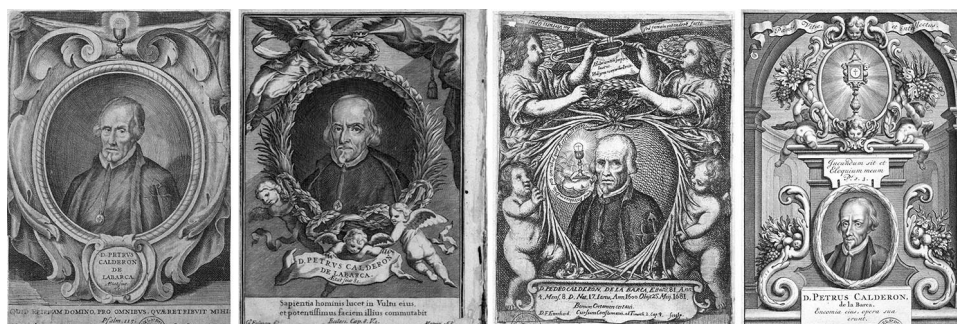
Figura 6. Grabados en cobre con retratos de Calderón de la Barca, según orden: Pedro Villafranca, en Calderón, Autos sacramentales... (1676); Gregorio Forstman, en Calderón, Octava parte de comedias... (1684); Francisco Antonio de Ettenhard, en Gaspar Agustín de Lara, Obelisco fúnebre, pirámide funesto... (1684) y Gerard Valk y Bernardo García, en Calderón, Autos sacramentales... (1717)

Hay un retrato de Calderón que tiene la autoridad de ser el único que vio el propio dramaturgo, pero no es un óleo sino un grabado. Es el que encabezó la primera edición de sus Autos sacramentales [...] de 1676, prácticamente idéntica a la estampa suelta que circuló del grabador Pedro Villafranca (c. 1615-1684) del que se conservan copias en la Biblioteca Nacional de España. La postura e indumentaria del retrato se parece a la imagen que tenemos de Alfaro, pero el rostro muestra significativas diferencias que cuesta explicar solo trayendo a colación la distinta edad (68 y 76 años) del modelo. Zafra en cambio concluye que los dos retratos son muy similares, e insinúa la interesante hipótesis de que el retrato de Villafranca sea una copia de un retrato al óleo desaparecido, tal como su retrato de Felipe IV [en el libro de Francisco de los Santos Descripción breve del monasterio de San Lorenzo el Real del Escorial... , Madrid, Imprenta Real, 1657] surge del retrato de Felipe IV de Juan Bautista Martínez del Mazo que se conserva en la National Gallery de Londres 52 . [Fig. 6]