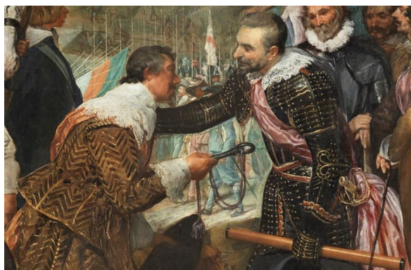
Figura 3. Velázquez, La rendición de Breda (1634-1635, Museo del Prado, Madrid). Detalle de la entrega de llaves entre Spínola y Nassau