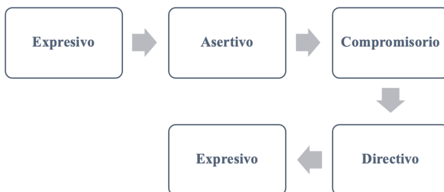
Figura 2. Actos de habla que estructuran las misivas de Isabel Delgada

La insistencia de Isabel Delgada está cargada de deferencia y humildad —con usos similares a las cartas de súplica 36 — tanto mediante las fórmulas de tratamiento y vasallaje como a través de ciertas estrategias comunicativas. Sus misivas responden a un tenor que ilustra la figura 2: