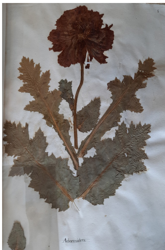
Imagen 3. Hojas y flor de adormidera. BCLM. Fondo Borbón-Lorenzana, Herbario, núm. 34020

En este sentido es muy sintomático que en el formidable herbario de su propiedad que conserva la Biblioteca de Castilla-La Mancha, repleto con 239 plantas secas exóticas o medicinales (como la adormidera o la tila) europeas, orientales y americanas, al final se conserva una carpetilla hojas y flores de la quina con la siguiente nota: «Hojas, tallos, flores, frutos de las dos especies del árbol de la quina, que no poseen en ningún Gabinete de Europa» 44 .