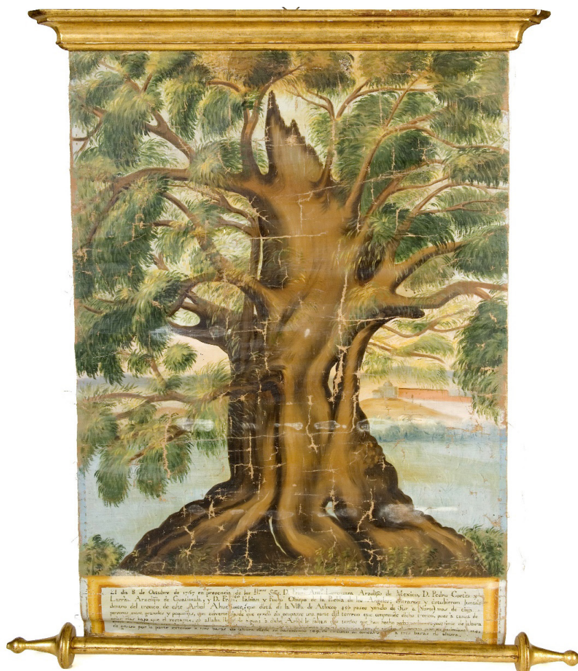
Imagen 2. Óleo sobre lienzo del gigantesco árbol ahuehuate existente en las afueras de Atlixco (Puebla, 1767). IES El Greco (Toledo), Colecciones históricas, núm. inventario 2518

una parte del terreno que comprende dicho tronco, pues a causa de estar más bajo que el restante se hallaba lleno de agua; a dicho árbol le faltan dos tercios que han hecho pedazos los rayos... [sus dimensiones son] 114 [varas de altura], de grueso por la parte exterior a tres varas de altura desde su nacimiento, 109 de circuito, su concavidad a tres varas de altura.