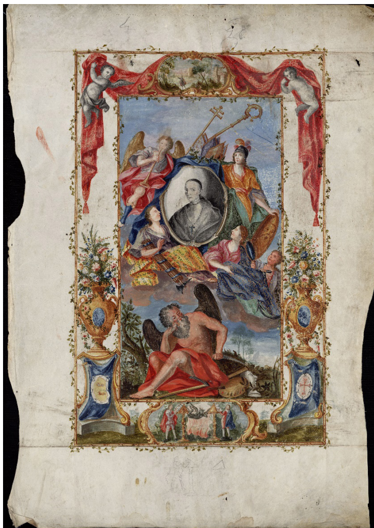
Imagen 1. Alegoría de Francisco Antonio de Lorenzana como mecenas de la cultura, por Santiago Palomares. Archivo y Biblioteca Capitulares de Toledo, Dibujos, núm. 209

se con Godoy cuando estaba en la cumbre del poder. Durante los siguientes años viajó a Roma, defenestrado de su archidiócesis por cuestiones políticas 7 ; murió en la Ciudad Eterna en 1804, sin dejar de patrocinar a un buen número de intelectuales a ambos lados del Atlántico. Humilde y caritativo, la inscripción fúnebre de su sepulcro proclamaba: «Aquí yace el padre de los pobres». En 1956, el Cabildo Metropolitano de México reclamó sus restos mortales desde Roma, trasladándolos hasta la capilla de los arzobispos en la catedral mexicana, donde reposan en la actualidad 8 .