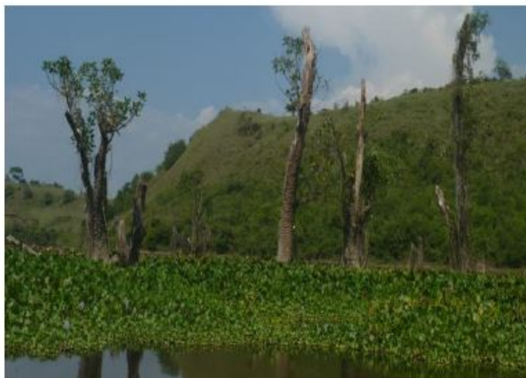
Figura 4. Material vegetativo flotante en el sector Laguna Cementerio – abajo del embalse El Quimbo