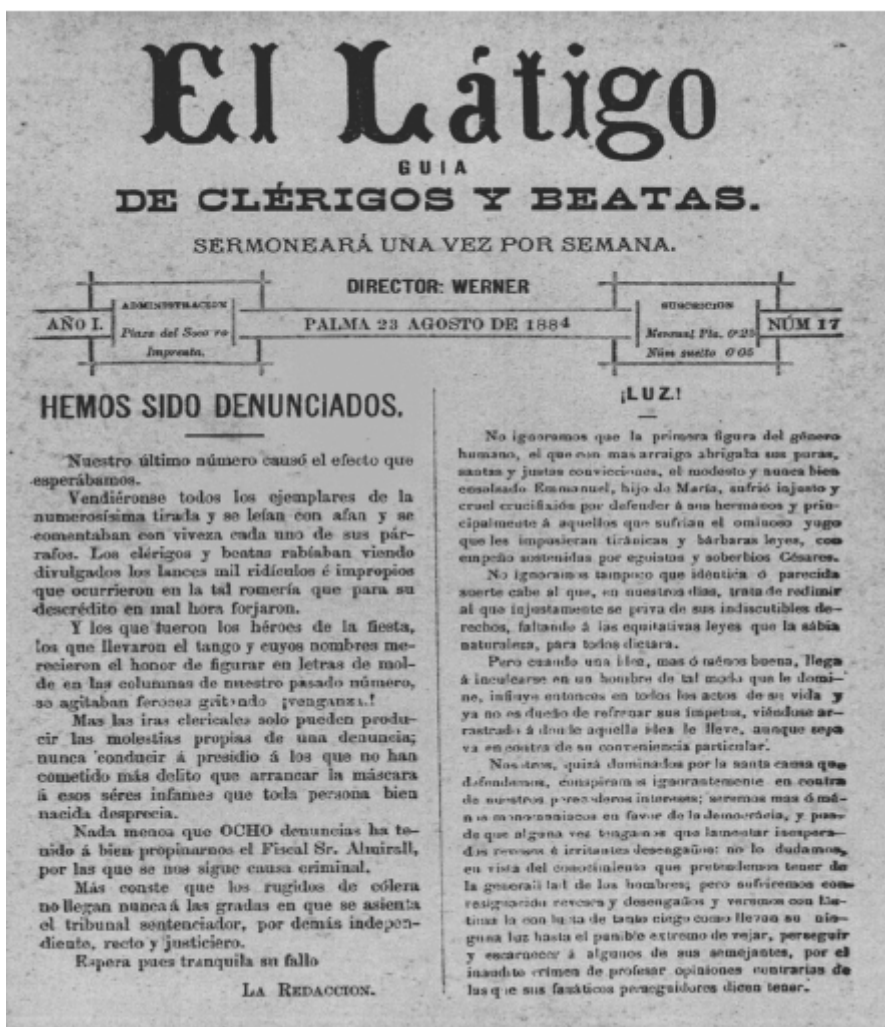
Portada del último número de El Látigo (23-8-1884)

derecho a su negocio y no se para en pelillos. Se la destina a usos muy comunes» ( El Látigo , 1, 1-5-1884).