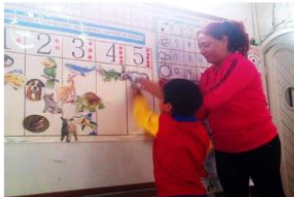
FIGURA 3 Estudiantes estimulando su nivel de conciencia silábica.