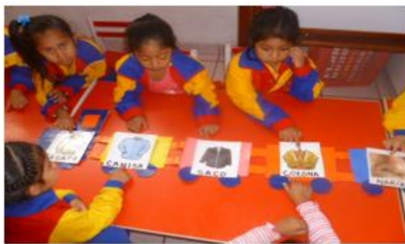
FIGURA 4 Estudiantes estimulando su nivel de conciencia fonémico.