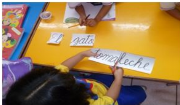
FIGURA 2 Estudiantes estimulando su nivel de conciencia léxica.

Esto debido a la adecuada oportuna y acertada aplicación del programa de estrategias metodológicas para estimular los niveles de conciencia fonológica: Jugamos a escuchar para comprender mejor, donde se logró estimular los tres niveles de la conciencia fonológica el cual ha repercutido positivamente en el desarrollo y logro de sus aprendizajes.