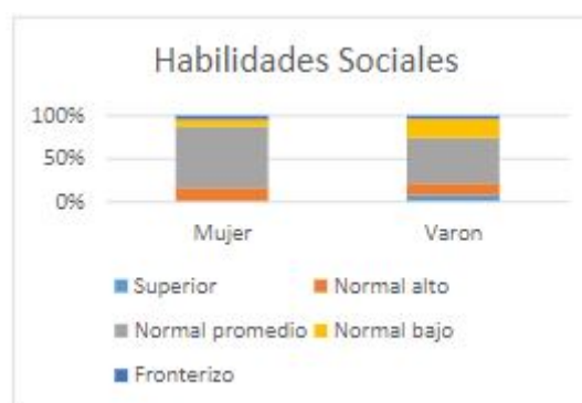
FIGURA 2 Niveles de habilidades sociales