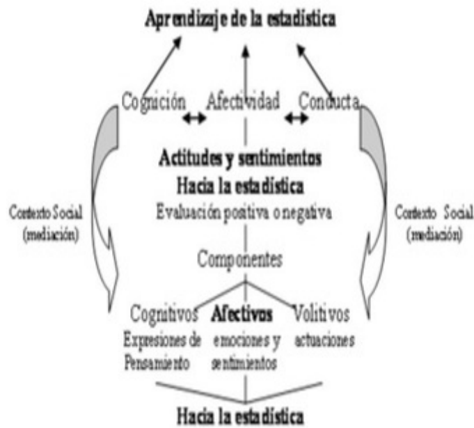
Figura N° 1: Componentes cognitivo, afectivo y volitivo en el proceso del aprendizaje de la Estadística Aparicio y Bazán (2008)

Aparicio y Bazán (2008), revisan diversas escalas de actitudes hacia la estadística utilizadas en diversos países, como en Brasil, tal es el caso del SAS: Statistics Attitudes Survey (Encuesta de actitudes estadísticas) elaborado por Dennis M. Roberts y Edward W. Bilderback en 1980; ATS: Attitudes Toward Statistics (Actitudes hacia la Estadística) elaborado por Steven L. Wiese en