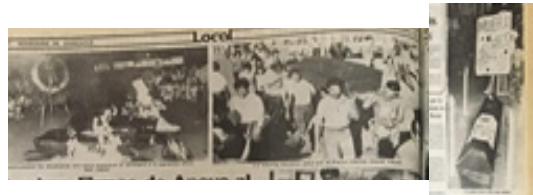
Figura 7. Nota periodística de Novedades del 8 de septiembre de 1985

De acuerdo con los diarios oficiales, el 7 de septiembre se unieron a los universitarios el Instituto Tecnológico de Chihuahua (ITCh) y al día siguiente ocurrió la quema de tres ataúdes al frente de la rectoría, simbolizando la muerte de De las Casas y sus incondicionales (véase figura 7).