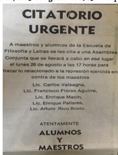
Figura 6. Citatorio dirigido a la base de la Escuela de Filosofía y Letras, el 25 de agosto de 1985 en el periódico Novedades