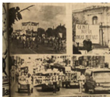
Figura 3. Mitin realizado el 18 de junio en contra de la reelección