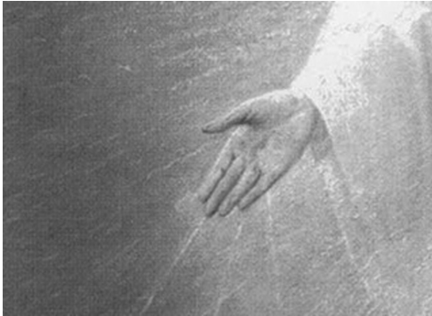
Detalle de manos y pies de Nuestra Señora de Todos los Pueblos.