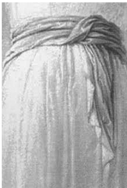
Imagen de Nuestra Señora de Todos los Pueblos y detalle del paño en la cintura.