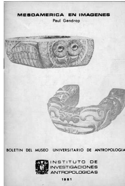
Figura 3. Portada del folleto de la exposición "Mesoamérica en imágenes" en el MUA (IIA1981).

El MUA mantuvo el objetivo de despertar la curiosidad de los visitantes por la antropología y el estudio del ser humano hasta que, como ya lo mencionamos, la mudanza del IIA en 1985 y nuevas prioridades administrativas intervinieron en su organización. Durante la gestión de la Dra. Mari Carmen Serra Puche como directora del IIA entre 1985 y 1991, el MUA tomó una nueva dirección evidente en la disminución de actividades y en una breve reaparición entre 1989 y 1991 con la exposición "¿Qué es la Antropología?". Con una clara intención educativa, el MUA resurgió, en el edificio actual del IIA, para comunicar el quehacer de las diferentes ramas antropológicas y temas como la evolución, la biología, la diversidad cultural, la historia, el lenguaje y los restos materiales. El discurso y la museografía eran ingeniosos, pues cada sección se distinguía por un color específico. La exposición recibía al visitante con la "Gran explosión", como el momento de origen del universo y con una explicación sobre el tiempo (en azul) y el