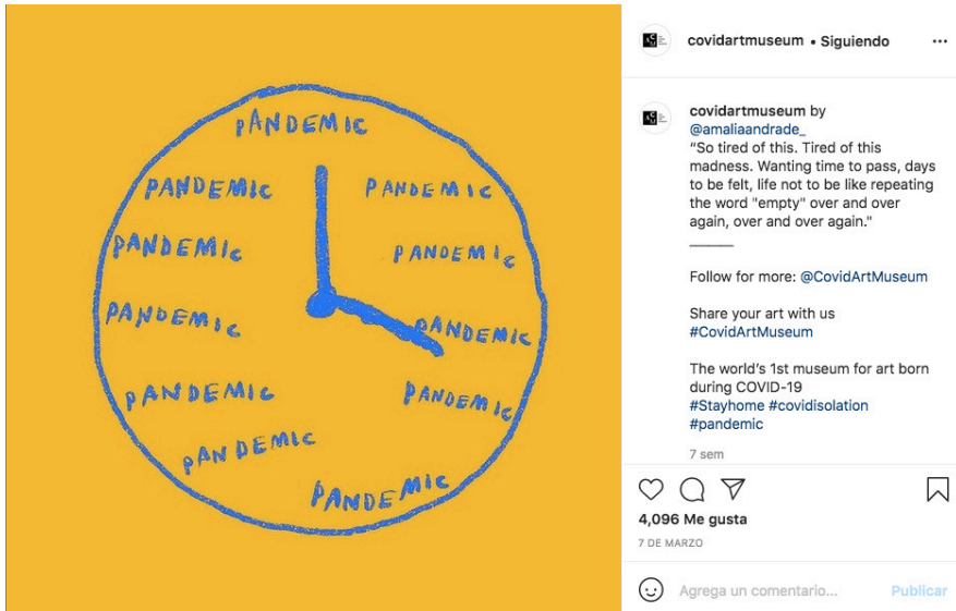
Figura 2. Siempre es pandemia. Obra de @amaliaandrade, exhibida el 7 de marzo de 2021 en el Covid Art Museum. instagram .

El reloj se detuvo también para los museos que vivían ya, desde hace más de una década, en una autodeclarada crisis [Navarro et al. 2010: 52]. Durante todo el 2019, los museos alrededor del mundo se sometieron a la dolorosa tarea de evaluar sus acciones y reconocer sus límites en el marco de la sociedad actual; esto con la finalidad de construir una nueva definición de museo cuya naturaleza operativa no hizo menos compleja la tarea ni limitó la participación de los especialistas con más de 250 definiciones alternativas. En septiembre de 2019, se celebró la 34 o Asamblea General del Consejo Internacional de Museos (ICOM) en Kioto, Japón, con un único punto en el orden del día: votar por una nueva definición de museo. Tras largas horas de discusión entre los comités nacionales e internacionales, el 70.41% de los asistentes votó en favor de posponer el proceso. 5