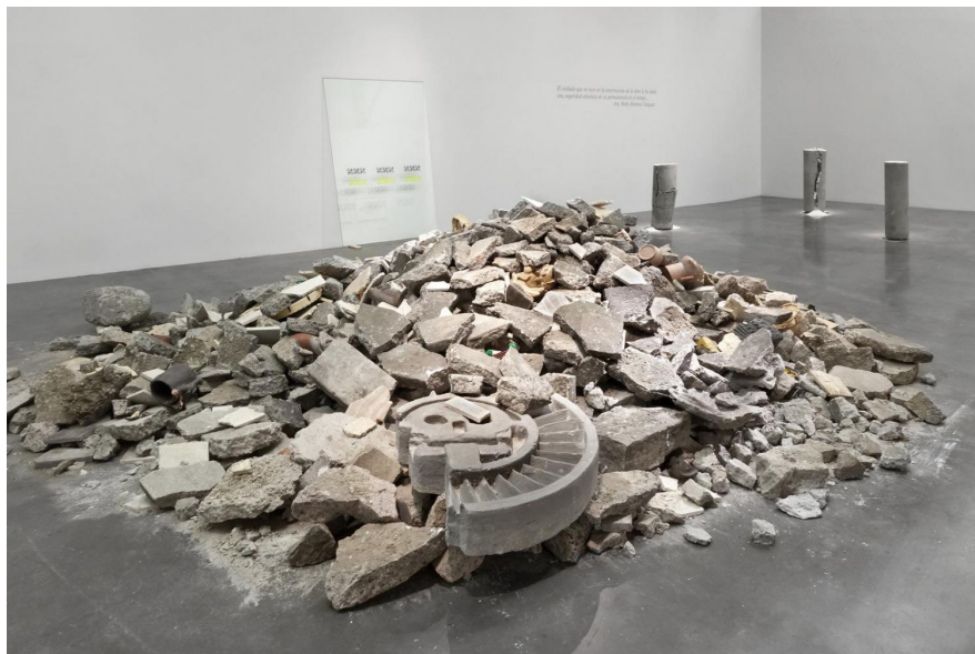
Figura 1. “Destrucción total del Museo de Antropología”. Eduardo Abaroa. 2012.