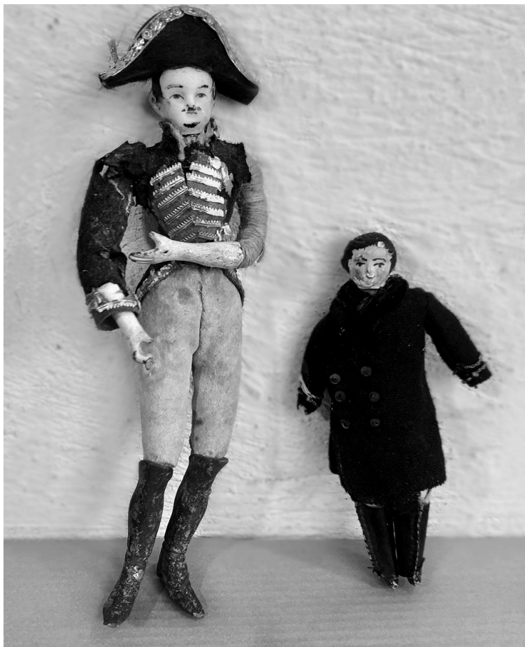
Foto 1. Muñecos elaborados en el último tercio del siglo XIX.

El consumo de soldaditos para jugar y construir al mismo tiempo escenarios de batallas fue una práctica aristocrática habitual en toda Europa. Brown [1996: 50] indica que a finales del XIX la amplia adquisición de esta clase de juguetes “armonizaba exactamente con el tono aparentemente agresivo y marcial de la contemporánea Gran Bretaña”. Le llama la atención que previo a la Primera Guerra Mundial, tirarse al suelo y jugar como niños, tal como solían hacerlo líderes británicos, reflejaba un profundo significado por dichas preocupaciones militares [Brown 1996: 1-2].