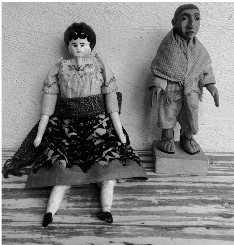
Foto 5. Figura muñeca China (cerámica esmaltada y tela) y figura indígena mexicano (madera y tela).

En su conjunto, el significado de estos juguetes se relacionó con un idealizado orden social. Entonces, estas cosas generalmente pequeñas de diversas características y precios, hechas en el extranjero o en el país, posibilitaron el despliegue de principios marciales que asociaran la construcción de la masculinidad con la guerra y la necesidad de usar la fuerza para imponer la paz, igual como las muñecas proporcionaron pautas para crear, desde la niñez, modelos de mujer dedicada a su casa, la crianza y la abnegación. Al final, todo estos significados coincidieron con la noción de patria que los porfiristas pregonaron, compuesta de personas sanas, decentes y prósperas.