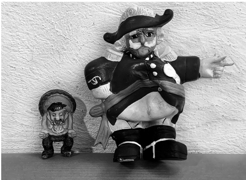
Foto 6. Juguetes del General Popo y ranchero.

sado y presente de aquella sociedad. Dichos objetos, obsequiados a adultos consumidores de diferentes mercancías capitalistas, finalmente llegaban a los hogares donde ocurría parte sustancial de la socialización de la niñez.