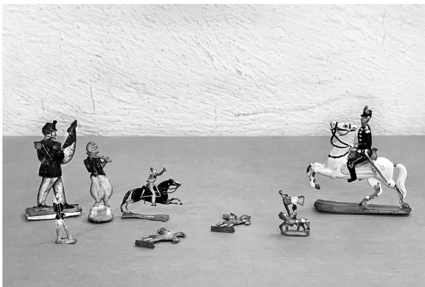
Foto 3. Figuras de soldaditos, diversos tamaños, finales siglo XIX.

Al igual que el muñeco de Maximiliano, también se jugaron diversas figuras bélicas asociadas al ejército francés y al republicano. Así, numerosos juguetes hechos en el extranjero y en el país —de plomo, madera o laminillas metálicas litografiadas— representaron diversos cuerpos de armas del ejército francés, cuyos uniformes fueron característicos de sus campañas en Egipto, Europa y en el México invadido a partir de 1863. 4 En contrapartida, soldaditos de los mismos tipos personificaron al ejército liberal mexicano que se opuso a la invasión extranjera, en los cuales se distinguían los colores habituales de sus vestimentas y la bandera con el águila republicana (foto 3). Estos juguetes recrearon en miniatura campos de batallas y hombres a caballo o a pie en actitudes marciales. Los escenarios de guerra contrastaron con juguetes para niñas, donde reconstruyeron también a escala su supuesto lugar en el mundo, asociado a las tareas de crianza o a las labores de cocina, todo siempre en el espacio del hogar.