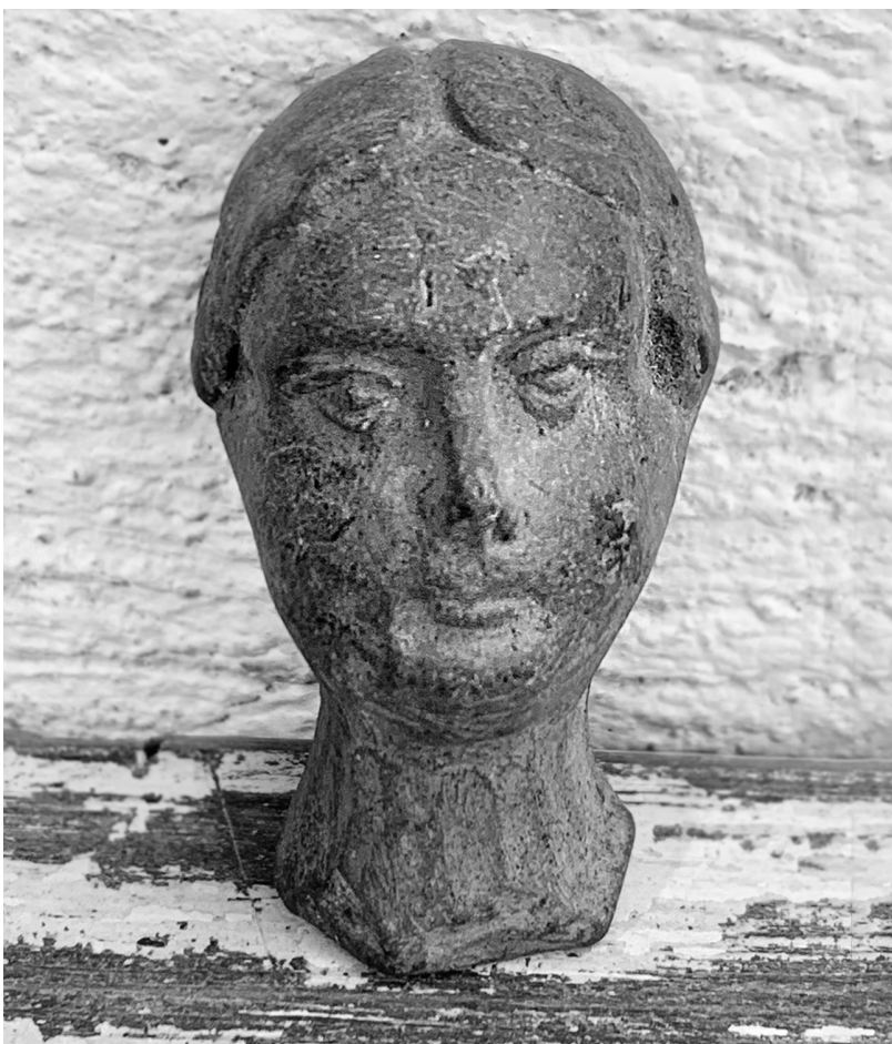
Foto 2. Cabeza de juguete de Maximiliano de Habsburgo.

En México los eventos históricos de la proclamación del Segundo Imperio y la guerra contra la Intervención Francesa por parte de facciones de republicanos alentaron el uso de imágenes bélicas y patriarcales de esa naturaleza. Por ejemplo, una pieza de juguete de Maximiliano de Habsburgo, muy probable del último tercio del siglo XIX, fue hecha en cerámica —en México o en el extranjero— y seguramente era un juguete que buscaba asemejarse a los de Napoleón y Nelson, descritos arriba. La cabeza es de barro o terracota, no puede asegurarse si llevaba un acabado más delicado al colocársele esmalte o convertirse en porcelana, pero es evidente que formaba parte de una figura antropomórfica completa (foto 2).