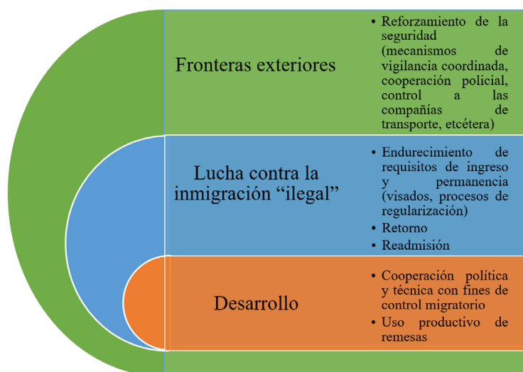
Figura 1. Matriz de gestión migratoria de la UE hacia los terceros países

A partir de Tampere se configuró lo que en este artículo se ha denominado la matriz de gestión migratoria de la UE (véase Figura 1), una forma de pensar y actuar políticamente enfocada al control y la contención de los movimientos poblacionales extracomunitarios, que está diseñada para trasponerse gradualmente en las estructuras de los países miembros y trasladarse a través de instrumentos de política exterior a los llamados terceros países (Santi Pereyra, 2021). Se alude al término matriz porque actúa como un modelo programático, que da forma e impacta en el tratamiento de las migraciones en las relaciones internacionales. Esta matriz de gestión migratoria de la UE , operativa hasta la actualidad, comprende los ejes de fronteras exteriores: lucha contra la inmigración “ilegal” y desarrollo, cada uno de los cuales envuelve categorías trazables en las políticas aplicadas por la UE y los países miembros hacia los terceros países.