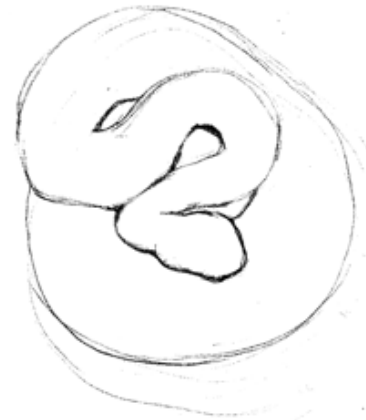
Imagen 4. Contorno de una serpiente . Dibujo. Stephanie Constantino-Vega, 2017.

En el proceso creativo que realiza la autora, el acto creativo es una búsqueda que comienza en los momentos anteriores a la ejecución del dibujo, porque responde a una elaboración de ideas que se estructuran en un diagrama visual (Imagen 5). 5 Estas ideas y conceptos forman parte del contenido de la obra, de manera circunstancial, porque van apareciendo poco a poco,