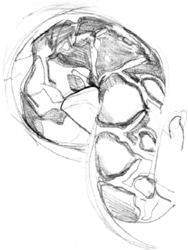
Imagen 6. Esquema de la distribución de manchas. Dibujo. Stephanie Constantino-Vega, 2017.