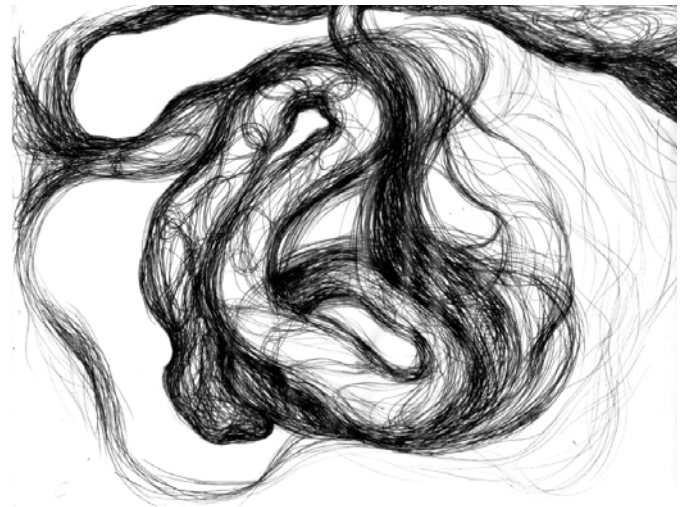
Imagen 5. Diagrama del movimiento de serpientes . Dibujo. Stephanie Constantino-Vega, 2017.