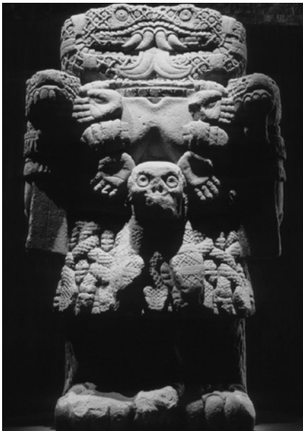
Imagen 3. Coatlicue . Fotografía. David Charles Wright-Carr, 1980.

en el Museo Nacional de Antropología, tallada en Tenochtitlan hacia finales de la época Prehispánica (López-Luján, 2009). Representa la madre Tierra, con el cuerpo lleno de elementos iconográficos derivados de las serpientes de cascabel, entre otros elementos igualmente impactantes, relacionados con la muerte: manos cortadas, corazones y un cráneo humano, formando un collar macabro. Su nombre deriva de la frase náhuatl Cōātl īcue , “serpiente es su falda” (Wright-Carr, 2018).