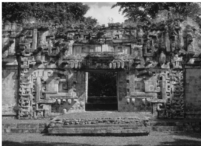
Imagen 2. Portada zoomorfa del edificio II de Chicanná, integrando dos rostros reptilianos de perfil y otro de frente. Fotografía. David Charles Wright-Carr, 1986.

Para las culturas mesoamericanas, la observación directa de la naturaleza fue la manera primordial para construir esquemas de interpretación, donde figuran montañas, plantas, animales, fenómenos naturales y reflexiones acerca de las relaciones del ser humano con su mundo, a través del tiempo y el espacio. Mediante esta capacidad de convivencia y comprensión de su entorno, las culturas mesoamericanas elaboraron sistemas de interpretación, visiones del mundo y narraciones simbólicas expresadas por medio de diversos lenguajes estéticos: arquitectura, escultura, pintura, danza y música. Desde el horizonte olmeca, los antiguos mesoamericanos aprendieron que la integración de reptiles en sus lenguajes estéticos, y de motivos iconográficos o formales derivados de ellos, los dotaba de un impacto emotivo descomunal. Un ejemplo sobresaliente del impacto estético de las imágenes de serpientes, integradas en una composición escultórica monumental, es la famosa Coatlicue de la Sala Mexica,