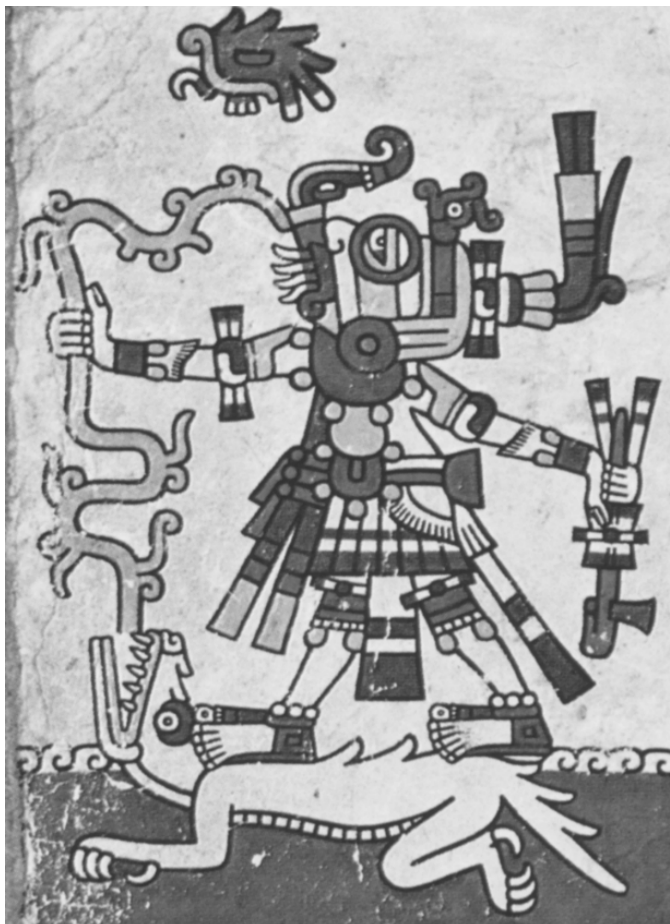
Imagen 1. El dios de la lluvia, con rasgos faciales serpentinos, se para en el dorso del reptil terrestre, que nada en el mar. Códice Fejérvary-Mayer (Anders, Jansen y Pérez, 1994: 4).

Novohispana. Algunas de sus manifestaciones más espectaculares, simbólicamente profundos y estéticamente potentes, son las portadas zoomorfas (Imagen 2), construidas por los mayas del centro de Yucatán durante el periodo Epiclásico, hacia 600-900 d. C. (Gendrop, 1983).