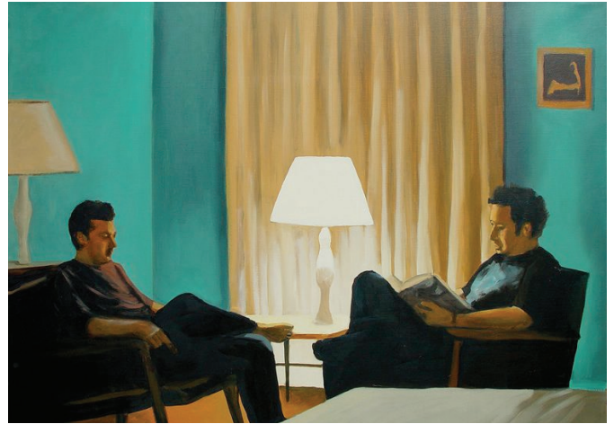
Imagen 7. Intimate Biography . Ángel Mateo Charris (1997).

y Sicre: ambos pintores incorporan esta atmósfera hopperiana como algo propio y volverán a recrear esos paisajes cada cierto tiempo, como en el cuadro Cabo de Palos (Sicre, 2015) o incluso con un nuevo retrato doble en Truro — Jóvenes pintores en Truro , Charris, 2016— (ver imagen 8). Está claro que esta historia no termina aquí, y como dice el tango que veinte años no es nada, en 2011 volvieron a embarcarse en otro viaje similar.