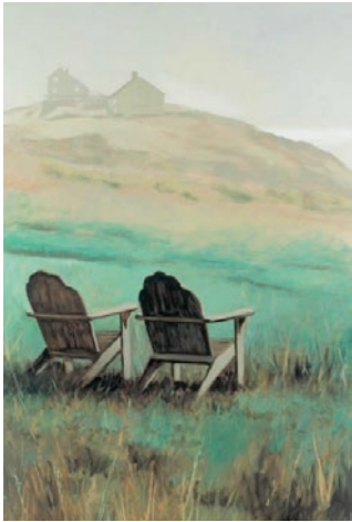
Imagen 5. Excursión a la filosofía (la casa de Hopper) . Ángel Mateo Charris (1996).