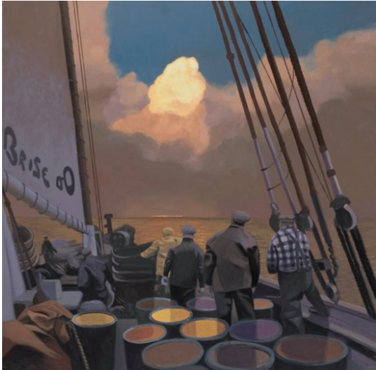
Imagen 13. Paintingland . Ángel Mateo Charris (2011).