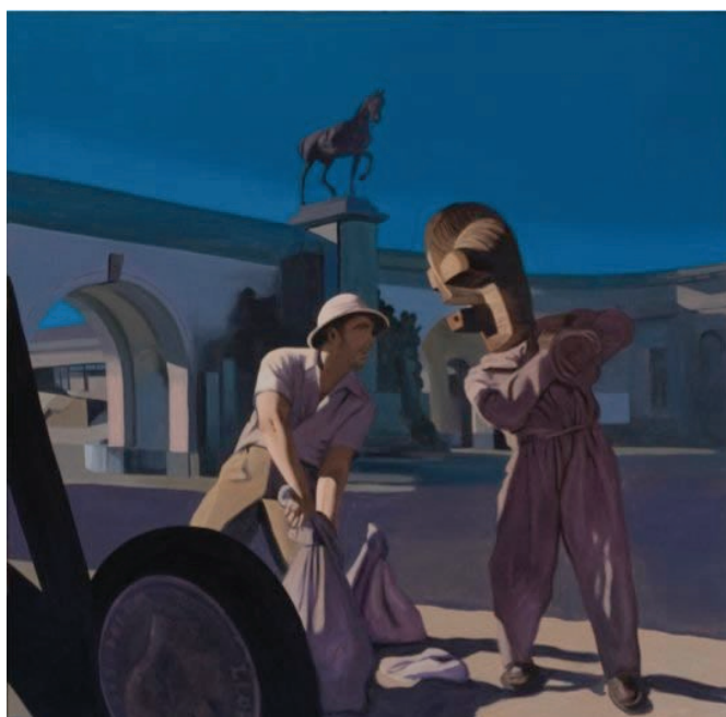
Imagen 12. Los fantasmas de Ostende . Ángel Mateo Charris (2011).