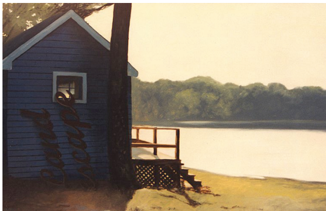
Imagen 4. Landscape . Ángel Mateo Charri (1997).