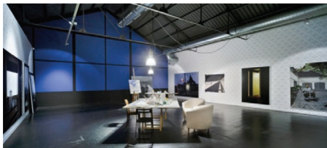
Imagen 9. Vista de la exposición Insomnio. Tras las huellas de Spilliaert . Ángel Mateo Charris (2011).

El texto de Charris, Los fantasmas de Ostende , me fascinó cuando lo leí hace años, y ha debido seguir creciendo lentamente en mi memoria, porque cuando volví a leerlo para escribir este ensayo, no encontré la atmósfera gótica que me había intrigado la primera vez. Este recuerdo aumentado puede servir como ejemplo del modo en que funciona este complejo entramado de imágenes y textos, como semillas que van creciendo según el fermento de cada cual. Charris se queja, en este ensayo narrativo, de lo limitada que sería la vida si solo nos conformáramos con lo que vemos en una fotografía documental. Hay que saber buscar los fantasmas pegados a cada lugar, esas presencias que se acaban desvaneciendo con el tiempo, pero que son lo que convierten a una ciudad en algo vivible. Más aún si la ciudad es desconocida: esos fantasmas funcionan como un comité de bienvenida, una comunidad de amigos que transforman las calles en lugares transitables. Charris evoca a Ensor, Spilliaert y Permecke discutiendo en una pequeña plaza, recrea las visitas fugaces de otras figuras coetáneas como Stefan Zweig o Joseph Roth, y espía a otros escapistas profesionales que acudieron a la ciudad para curarse del hastío, como el músico Martin Gaye, o a terminar un libro infinito, como la teósofa Madame Blavatsky, encerrada en un hotelito mientras escribía su obra monumental. Charris los proyecta en las calles y se pregunta por la importancia y el volumen de esa