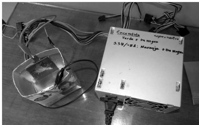
Sistema de grabado electrolítico, con una fuente de poder de una computadora y una caja tetrabrik como cubeta. El electrodo positivo (cable rojo) se conecta a la placa de grabado y el negativo (negro) a la placa receptora, en este caso una hoja de papel aluminio. El cable verde de la fuente se ha unido a uno de los cables negros para encenderla.

Con este sistema se obtienen líneas adecuadas (aguafuerte) en aluminio con un tiempo de 3 a 5 minutos, para zinc ese tiempo es de 5 a 10 minutos, para hierro se aumenta de 15 a 20 minutos, para acero inoxidable es cercano a los 30 minutos y para cobre oscila entre 45 y 60 minutos. Estos son tiempos aproximados, por lo que el grabador debe experimentar con su sistema para calcular los tiempos de acuerdo con el tamaño de la placa, el diseño y la estética que desee (Hernández-Chavarría, 2014).