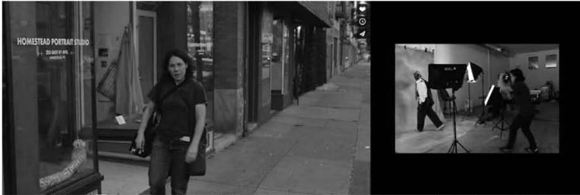
Imagen 4. Fotografías de Zoe Strauss en el estudio fotográfico de Homestead. http://homesteadpa.tumblr.com/ [consultado el 2 de agosto de 2015].