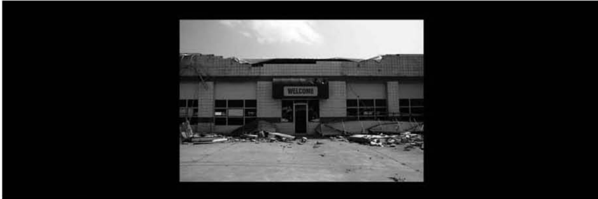
Imagen 1. Welcome. 2011.