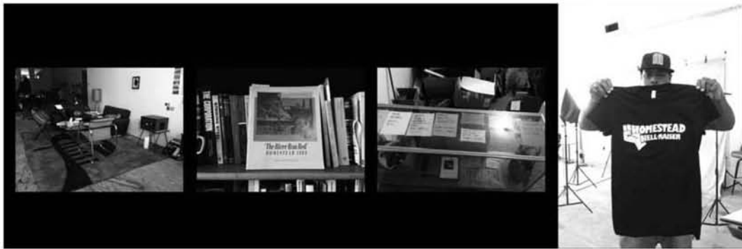
Imagen 6. Detalles de Homesteading. Fotografías de Zoe Strauss. http://homesteadpa.tumblr.com/ [consultado el 2 de agosto de 2015].

Cuando Strauss abrió el estudio, vio con satisfacción que la gente se animaba a hablar. 9 La propia Strauss impulsaba esas conversaciones: llevaba libros sobre la historia de la ciudad, y les preguntaba por sus