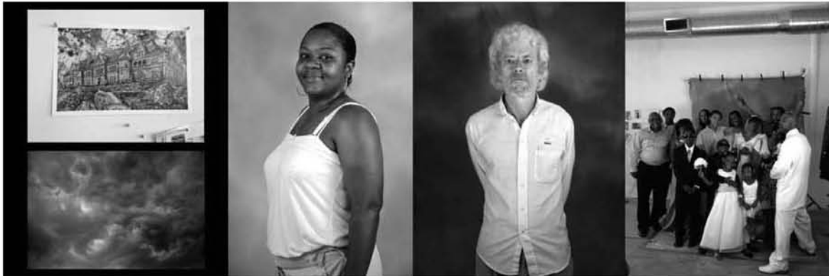
Imagen 5. Detalles de Homesteading. Fotografías de Zoe Strauss. http://homesteadpa.tumblr.com/ [consultado el 2 de agosto de 2015].

Strauss se comprometía a tomar una fotografía de cada persona (o grupo), de la que sacaría tres copias de 5 x 7 pulgadas: una para la exposición en la Fundación Carnegie (que se quedaría en la colección permanente del museo); otra para el retratado; y otra para los archivos personales de la fotógrafa.