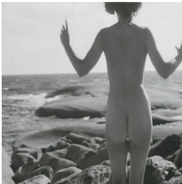
Imagen 1. “Un paseo con Mónica” ( Sommaren med Monika ). Ingmar Bergman (1953)

La idea de la mujer como una tradición discursiva que se ha conformado como algo digno de contemplación se percibe en las películas: Le Mépris (“El desprecio”, Jean-Luc Godard, 1963); “Bajo la piel” ( Under the skin , Jonathan Glazer, 2013); Blue is Warmest colour (“La vida de Adèle”, Abdelatif Kechiche, 2013); y en “Un paseo con Mónica” ( Sommaren med Monika , Ingmar Bergman, 1953) —esta película es previa a la apertura sexual de los años 60—.