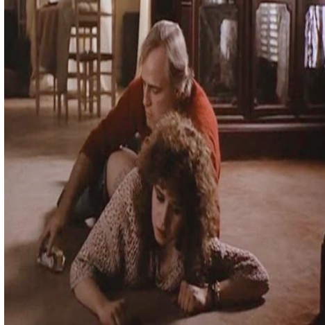
Imagen 4. "El último tango en París" ( The last tango in Paris ). Bernardo Bertolucci (1972)

Estereotipos del cuerpo desnudo femenino en el cine moderno: Análisis desde los estudios visuales y el feminismo