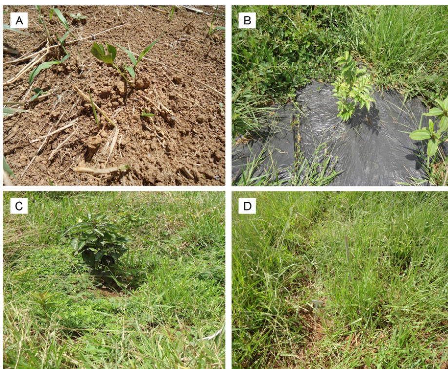
FIGURA 2: A) Plantio de mudas de Arachis ; B) Manta plástica; C) Semeadura a lanço do cultivar estilósantes Campo Grande e D) testemunha.