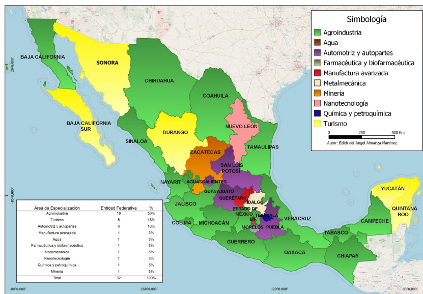
FIGURA 2. Distribución geográfica de las áreas de especialización prioritarias