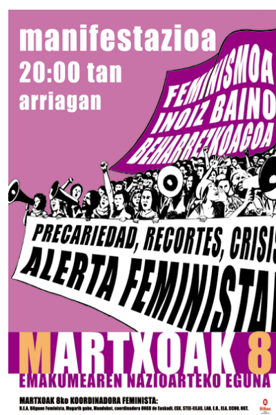
Figura 3. Cartel para la manifestación del 8-M en Bizkaia, 2011