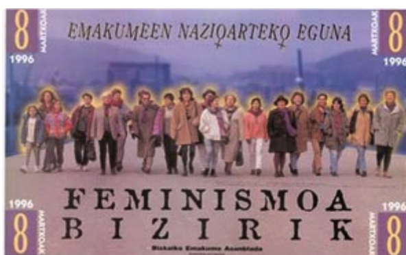
Figura 1. Cartel para la manifestación del 8-M en Bizkaia, 1996

La importancia de estar con otras, de activar o reiterar relaciones, tiene claramente una capacidad performativa: el movimiento existe y se materializa (parcialmente) en el espacio-tiempo de la manifestación. Varios carteles utilizados para la convocatoria de manifestaciones revelan la performatividad del estar juntas; el sujeto se representa a través del cuerpo colectivo (Esteban, 2009) (ver figuras 1, 2 y 3).