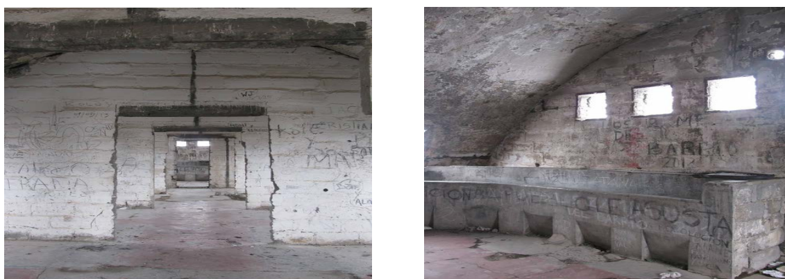
Figuras 6. Izq. Interior pabellón de obreros. Der. Zona de aseo. Ruinas del ex campamento obrero-militar Embalse el Yeso. (Fotografías de la autora).

Estos vestigios con sus presencias y sus ausencias también contienen una memoria oculta, que no es explícita, que no tiene registro y que en su condición de abandono y deterioro queda como enigma. No obstante, los fragmentos de sus espacios y formas arquitectónicas permiten imaginar y hacer supuestos de una determinada acción humana, aquella que posiblemente les dio su origen, cual obra arqueológica que genera asombro y curiosidad informándonos de su historia (Fig. 6). Su emplazamiento, alejado de todo asentamiento poblado y las permanentes dificultades de acceso, determinan la inexistencia de una memoria social, un relato respecto del lugar. Esto da pie a mitificaciones o tergiversaciones respecto de su origen.