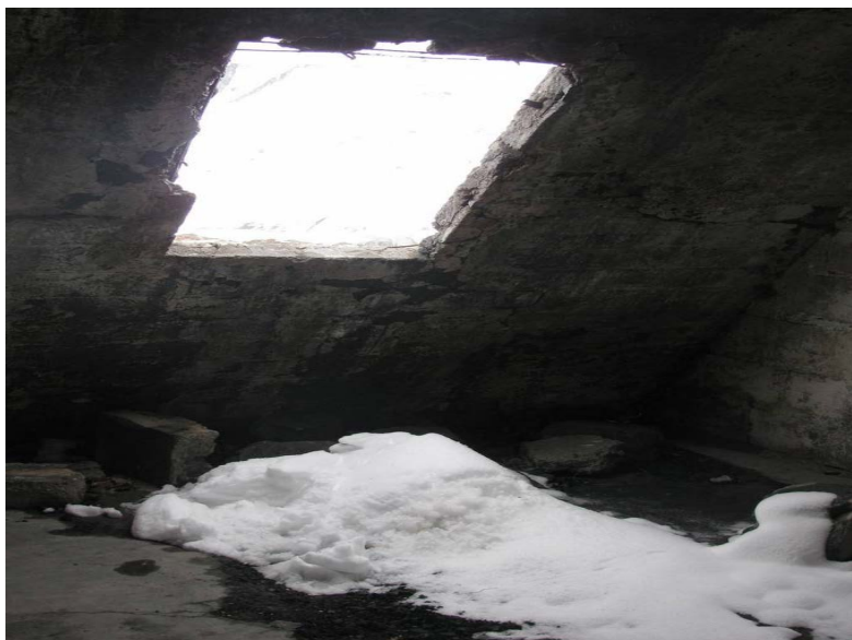
Figura 8. Interior pabellón obrero ex campamento Embalse el Yeso. (Fotografías de la autora).