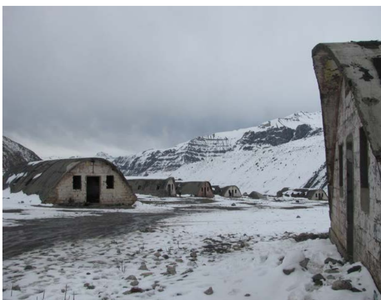
Figura 4. Ruinas del conjunto de pabellones abovedados del ex campamento obrero-militar Embalse el Yeso. (Fotografías de la autora).

Según información existente en el Ministerio de Obras Públicas, las edificaciones corresponderían a las viviendas de los obreros y profesionales que trabajaron en la