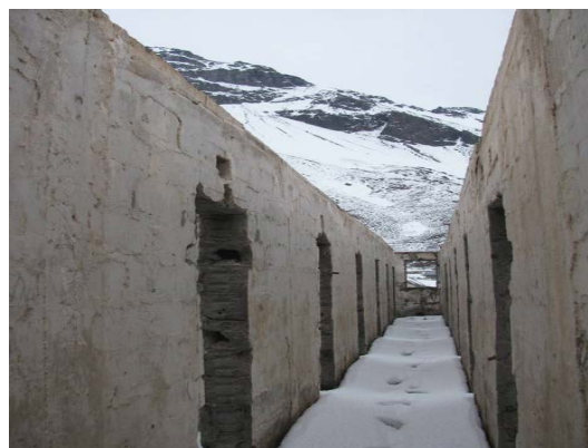
Figuras 5. Izq. Pabellones para obreros, camuflados en el paisaje. Der. Ruinas de un pabellón tradicional de ingenieros del ex campamento obrero-militar Embalse el Yeso.

En este caso vemos los tres estadios del proceso de ruina como parte de una lectura temporal. Por un lado, un singular conjunto arquitectónico que pierde su funcionalidad y es paulatinamente abandonado, con un periodo de desmantelación propio de la acción humana frente a un lugar sin conservación ni protección, esto se entiende como un “primer estadio”. En este caso se han eliminado todas las carpinterías de puertas y ventanas, las techumbres, artefactos sanitarios, instalaciones, etc. Solo quedan los elementos esenciales de la estructura arquitectónica.