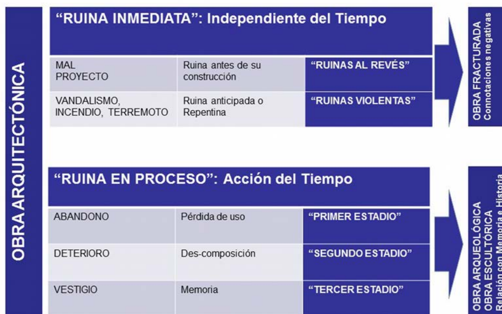
Figura 1. Esquema conceptual de la transformación de una obra arquitectónica en ruina.

Existen distintos modos en que una edificación llega a constituirse en ruina. Una forma de análisis de esta condición es en función de la acción del tiempo, según la cual, las podemos clasificar en dos grandes grupos: “ruina inmediata” y “ruina en proceso” (Fig. 1).