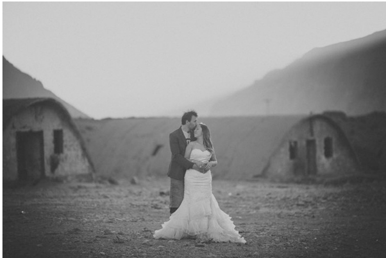
Figura 7. Sesión fotográfica para matrimonio en el ex campamento obrero-militar Embalse el Yeso.

Quienes descubren este lugar son capaces de develar en él un nuevo sentido de espacio estético y de belleza confrontada al deterioro, tanto en su camuflaje invernal, como en su similitud a un campo lunar en verano. En este aprovechamiento de su estética contemporánea y de su particularidad morfológica, hasta cierto punto lúdica, la ruina ha sido aprovechada, incluso, para sesiones fotográficas del más amplio espectro, desde modelaje, vehículos, hasta sesiones de novios (Fig. 7).