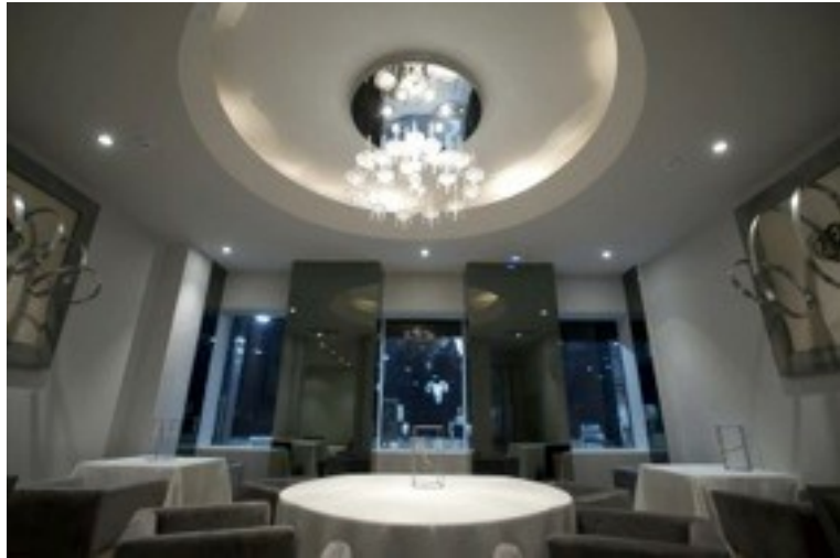
Figura 1: Vista de la cocina vidriada desde la sala del restaurante La Cabra , Madrid (octubre 2015)

Algunos chefs ya han derribado totalmente esta cuarta pared que separa la cocina del comedor, remplazándola por varios dispositivos. En el restaurante Dstage , de Diego Guerrero, encontramos la escenografía ya clásica de una cocina abierta hacia la sala: ofrece a los comensales el espectáculo del chef y de su equipo en plena acción. Notemos que Dstage sería la pronunciación a la española del inglés “ the stage ”, que significa “el escenario” ... (ver figura 2).