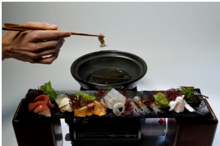
Figura 4: Un shabu shabu de mar, servido en Dos Palillos (agosto 2016)

Este ejemplo es comparable con una experiencia artística que sumerge a su receptor activo en el proceso, implicándolo además con todos los sentidos. El huésped está inmerso en un “arte de participación”, en donde el receptor no sólo transforma la obra por la interpretación de su significado, sino que modifica “la obra misma como objeto sensible, material dotado de cierta forma” (Sánchez, 2005, p. 11). Por ello, hablaremos de espectactor : el comensal es activo en la creación continua de la propuesta gastronómica, incluso puede llegar a ser el “co-autor” del plato propuesto, lo que también modificará el estatuto del creador, que puede ser creador o participan-