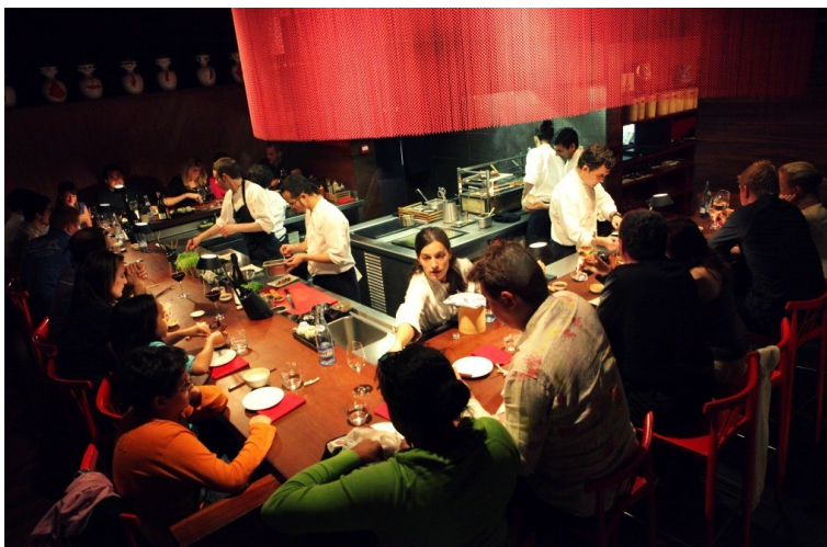
Figura 3: Vista de la sala-cocina de Dos Palillos , Barcelona (agosto 2016)

En el caso del restaurante Dos Palillos de A. Raurich, el dispositivo central es una mesa-bar, en forma de U, en torno a la cual los huéspedes se sientan (ver figura 3).