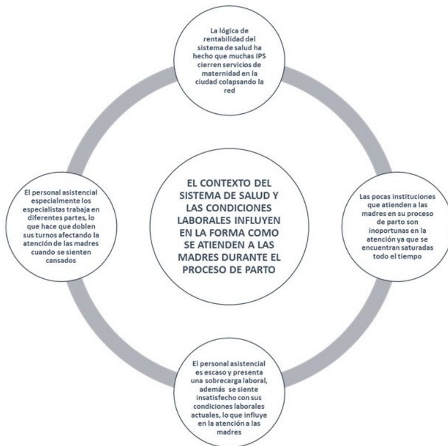
FIGURA 2 Modelo explicativo del fenómeno central con las cuatro categorías que lo sustentan