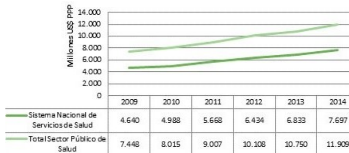
FIGURA 1 Gasto del sector público de salud de Chile (en millones de dólares, PPP).

Junto a lo anterior, es bien sabido que la calidad de los servicios de salud es un tema estratégico en casi todos los países (3). Por citar solamente un ejemplo, en Chile la importancia cuantitativa de los servicios de salud se ha incrementado a lo largo del tiempo. Como se puede apreciar en la figura 1, en este país el gasto total en el sector público de salud (que reúne a los servicios públicos de atención a los pacientes) ha aumentado entre los años 2009 y 2014, en correspondencia y casi en paralelo con el gasto en servicios durante dichos años en el Sistema Nacional de Salud (figura 1).