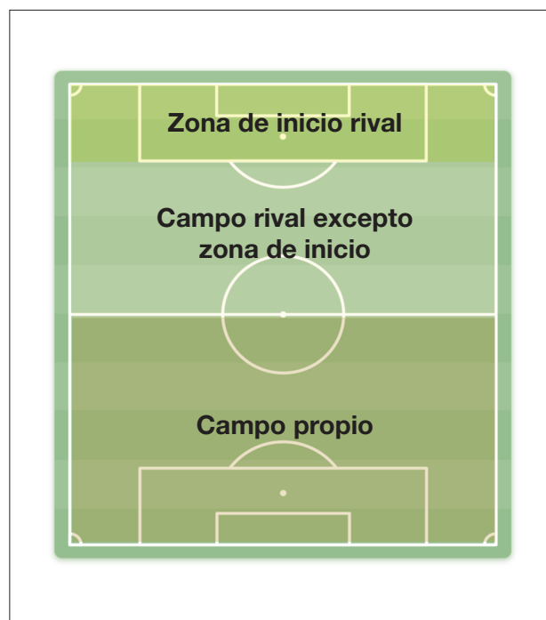
Figura 1 Zonas de recuperación para registrar los goles en transición.