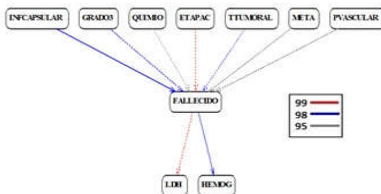
Fig. 3. Grafo implicativo en modo cono para las relaciones causales de los factores pronósticos que influyeron en el peor desenlace (fallecido).

Por otro lado, indirectamente y con una intensidad del 99 %, se observa la relación implicativa entre haber fallecido y tener niveles elevados de LDH o directamente y con una intensidad de implicación comprendida en el intervalo 98 %, 99 % tener hemoglobina baja.