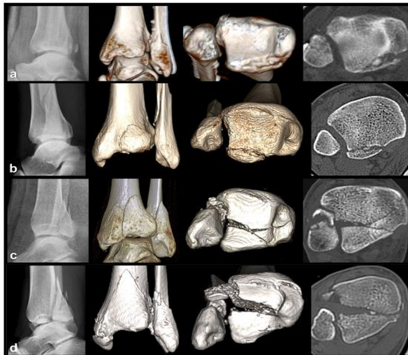
Fig. 2. Clasificación de Bartoníček, et al. 2a. Fractura tipo 1. 2b. Fractura tipo 2. 2c. Fractura tipo 3. 2d. Fractura tipo 4.

Tomado de: Bartoníček J, Rammelt S, Kostlivy, Vaněček V, Klika D, Trešl I. Anatomy and classification of the posterior tibial fragment in ankle fracture. Arch Orthop Trauma Surg. 2015; 135: 505-516. DOI: https://doi.org/10.1007/s00402-015-2171-4