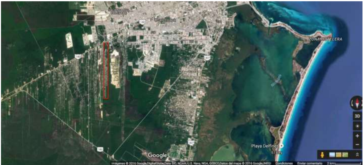
marcas realizadas por la autora