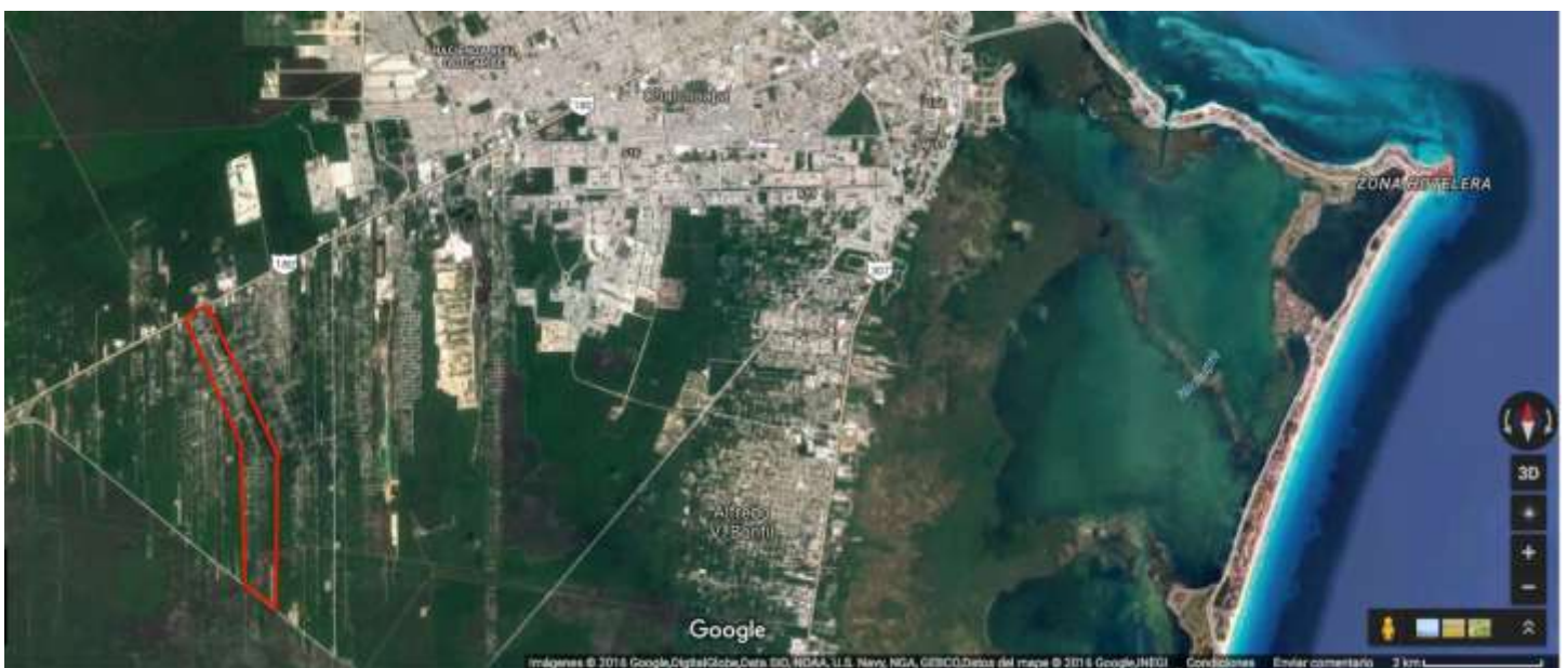
Tomado de Google–Inegi 2016, marcas realizadas por la autora