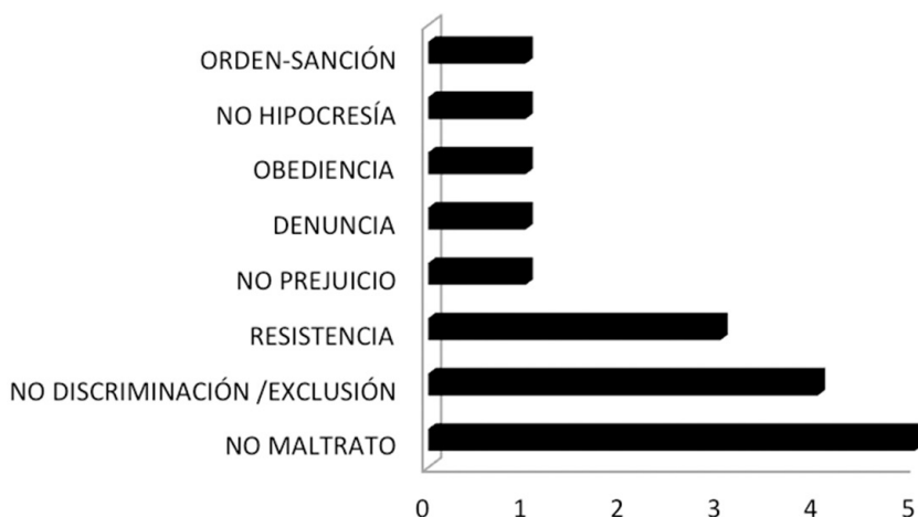
Gráfica 2. Diecisiete propuestas basadas en la libertad negativa

La gráfica n°2 muestra el énfasis en el no-maltrato como principal propuesta. Después siguen varias basadas en la no-discriminación, no-exclusión (como respuesta ante el problema ya testimoniado de la exclusión por el color de la piel en Hidalgo), ligado a otra que se expresa como un no-prejuicio: No juzgar antes de conocer a los niños (Hidalgo), o bien en resistir (Oaxaca):