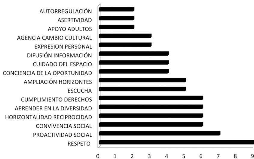
Gráfica 3. Setenta y cuatro propuestas para construir una cultura inclusiva

La proactividad se define en términos de ayuda (Q. Roo), en términos de crear o ampliar las redes sociales, de ir más allá del espacio escolar, de dar y tomar la iniciativa para buscar la relación, de nuevo fraseado por un(a) estudiante de