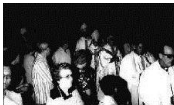
Fig. 3- Procesión de la Fiesta Patronal de La Candelaria, el 2 de febrero de 1963, en el municipio Candelaria

Las patronales más tradicionales en Pinar del Río son las de La Candelaria. Esto se debe a que fue mantenida por descendientes de los muchos canarios que poblaron la provincia (Feliú, 2003). Entre estas, se destacaba la del hoy municipio Candelaria, donde desde el año 1875 comenzó a realizarse con gran afluencia de vecinos procedentes de toda la provincia (Estrada, 2000).