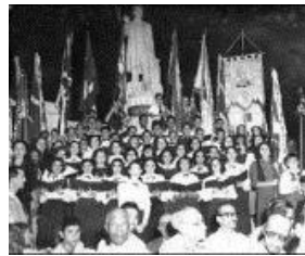
Fig. 4- Recorrido por las calles de la ciudad de Pinar del Río, en la década del 50 del siglo XX, de la procesión en la fiesta patronal de San Rosendo. Acto de reafirmación patriótica en el parque Martí de esta ciudad

Aunque en su momento tuvieron gran acogida popular, actualmente solo son celebradas algunas fiestas patronales, la mayoría dentro de las áreas de las iglesias católicas de las localidades del territorio. La procesión, rito principal, dejó de ser pública, como también las otras actividades de participación popular, al quedar limitada al recinto de la iglesia donde, además de los actos religiosos como la misa etc., se realizan la fiesta de la canastilla, la venta de comida y ropa, entre otras actividades.