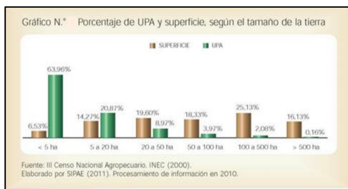
Gráfico 1. Porcentaje UPA por superficie