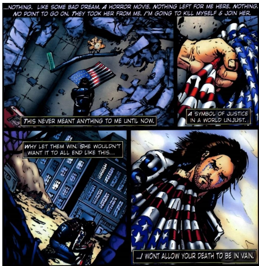
Figura 3: Clint lamenta a morte de Sarah e através dela estabelece sua conexão com seu país e o que sua bandeira representa

Fonte: WEITH, Graig F. Civilian Justice , 2002, p. 9.