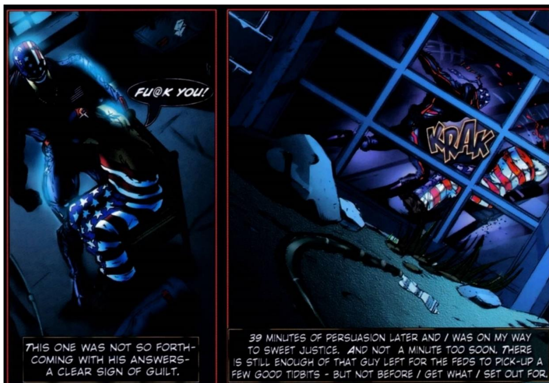
Figura 5: Clint tortura seu prisioneiro enrolado na bandeira dos Estados Unidos, sugerindo que a nação toda apoia a prática