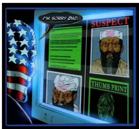
Figura 4: Três quadros de Civilian Justice , nos quais vemos os terroristas muçulmanos representados de forma monstruosa e desumanizada