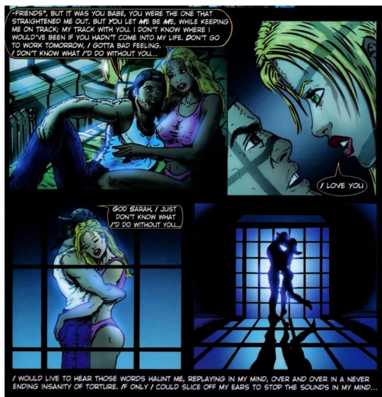
Figura 2: Clint e Sarah juntos no único momento no qual a personagem aparece ante de morrer nos ataques às Torres Gêmeas

Fonte: WEITH, Graig F. Civilian Justice , 2002, p. 7.