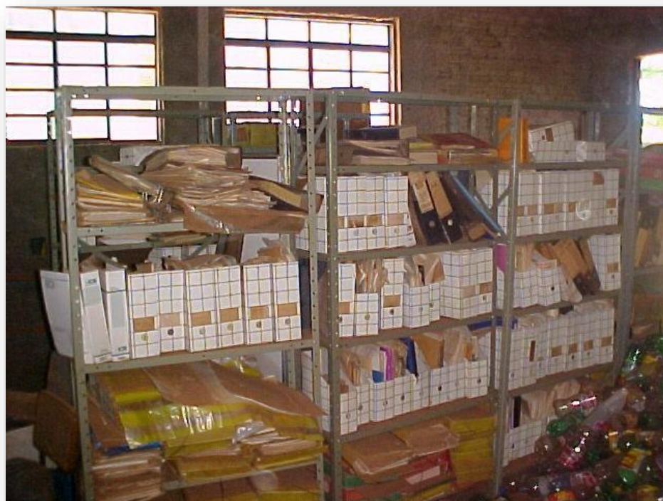
Imagem 2: Primeira fileira de estantes no interior do galpão, 2004.