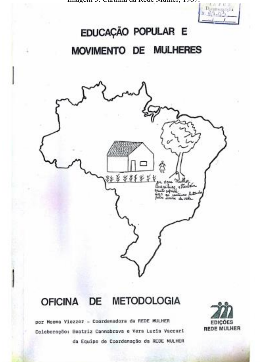
Imagem 5: Cartilha da Rede Mulher, 1987.

Destacamos alguns exemplos de fontes presentes no acervo do IAJES: