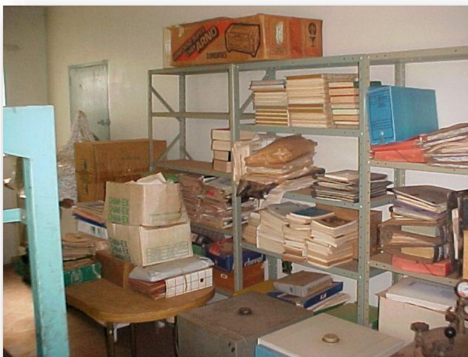
Imagem 3: Quarto anexo do galpão com mais estantes e equipamentos do IAJES, 2004.