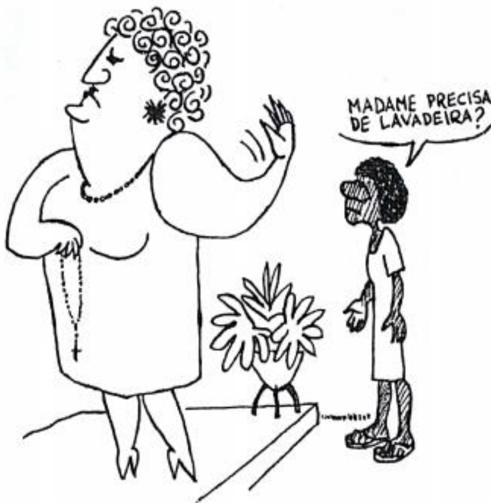
Imagem 7: Imagem presente no Convite do I Encontro de Três Lagoas, 1984 e na Edição nº 5 do Boletim Vai e Vem, de 1982.