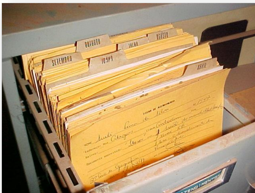
Imagem 4: Interior de um arquivo de aço presente no galpão, 2004.