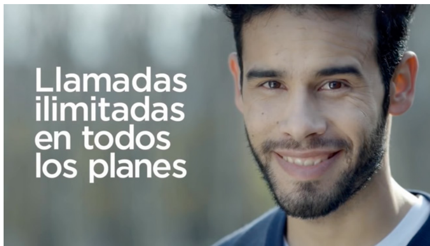
Figura 1: Llamadas ilimitadas (Claro, 2015): el teléfono móvil dado por hecho.

Uno de los últimos spots de Claro incluidos en la muestra ( Llamadas ilimitadas , 2015) muestra un zoom sobre el rostro de un joven con cierto aspecto hipster y que –mirando a la cámara– va ampliando su sonrisa a medida que la pantalla queda cubierta por la frase «Llamadas ilimitadas en todos los planes». Eso, y el logo de la empresa, son elementos suficientes para localizar la oferta comercial de manera precisa.