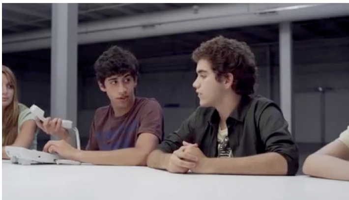
Figura 5: Cumpleaños (Movistar, 2011): el mantenimiento del contacto con los pares en primer lugar