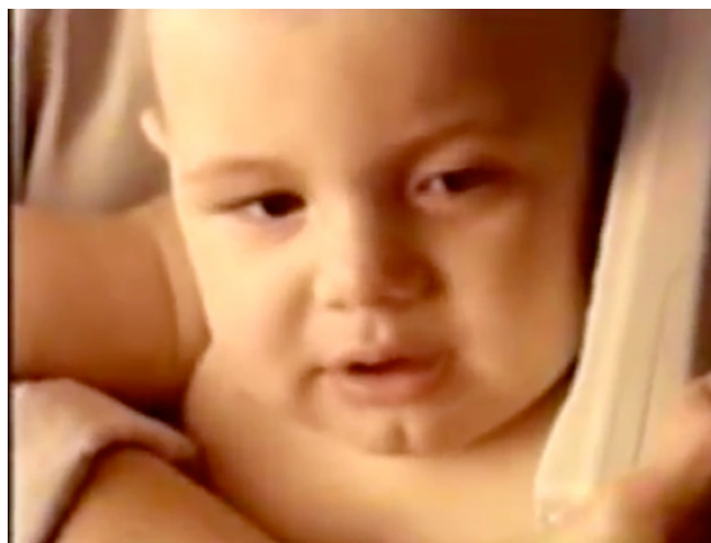
Figura 4: Bebé (Unifon, 1999): apelación a razones poderosas en una etapa aún introductoria de la tecnología

el país, pero por ahora señalemos solamente que su uso (su adquisición) requiere aún justificaciones de peso: una tarea que obliga a la distancia de la casa y de los nuestros, una necesidad comunicativa particularmente poderosa (como el sostenimiento de la relación madre-bebé).