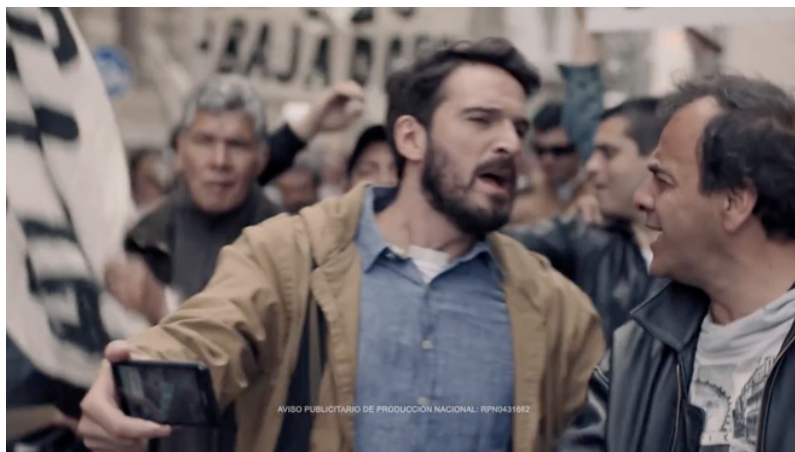
Figura 6: Periodista (Movistar, 2015): la polivalencia de los profesionales de los medios de comunicación en pantalla

Si acaso quedara alguna duda, lo que estamos diciendo es que en una pieza publicitaria se hace apología de la precarización del trabajo periodístico ya que se legitima la ausencia de otros trabajadores por «innecesarios».