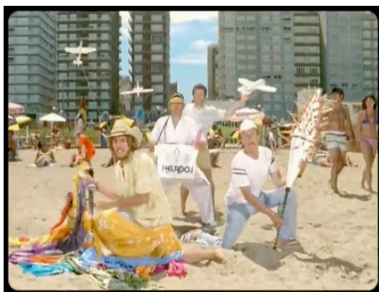
Figura 2: El tema del verano (CTI Móvil, 2006): un aviso creativo y una producción importante para vender la capacidad de reproducción de archivos mp3

muestra el primer spot que refiere a esta posibilidad es de 2006 y es, justamente, uno muy exitoso, El tema del verano (CTI Móvil): una secuencia de imágenes playeeras en clave paródica constituye la coreografía de un supuesto hit veraniego (cuyo estribillo repite monótonamente «que te clavo la sombrilla») hasta que un joven se «defiende» de la canción escuchando un ritmo de reggae en los auriculares de su teléfono, mientras el locutor cierra diciendo «El tema del verano es más peligroso que el sol. Protegete con tu CTI con mp3 y ponete tu música al verano». El equipo publicitado era un Nokia 5200, cuya característica promocional saliente era –justamente– su reproductor de música digital.