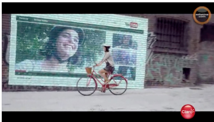
Figura 3: Viví ilimitado (Claro, 2013): el acceso móvil e instantáneo a las redes

Justamente, el acceso a Internet con el fin de navegar en la web muestra una evolución creciente, aunque no con la nitidez esperable: pasa del 5,7% de los usos identificados en las primeras etapas al 10,7% en la tercera y de ahí al 13,7% en la última. Con todo, estos valores deben ser interpretados junto a los de la función «Redes sociales», que sí –como es esperable– muestra un crecimiento más marcado: de su inexistencia en las primeras etapas a un muy escaso 1,3% en la tercera etapa y a un 17,3% en la última. De hecho, es la funcionalidad con la tasa de crecimiento más alta (y por mucho) entre la tercera y la cuarta etapa, ya que crece casi trece veces. Podríamos decir que cuando las operadoras publicitan como servicio el acceso a Internet, el argumento de venta utilizado es la posibilidad de acceso a las redes sociales, frente a otros posibles usos. En 2013, por caso, Claro lanza una campaña con el lema «Viví ilimitado», apuntando a fortalecer las opciones de planes pos-pagos; en el spot se proponen varias funcionalidades, pero cada uso tiene por finalidad el posteo en redes sociales (se sacan fotos de los niños en la escuela para subirlas a Facebook, se toma un video de un paseo para colocarlo en Youtube, se envían mensajes por Whatsapp o Twitter). El «vivir sin límites» se asocia directamente a mantener el vínculo con los otros por vía de las redes sociales.