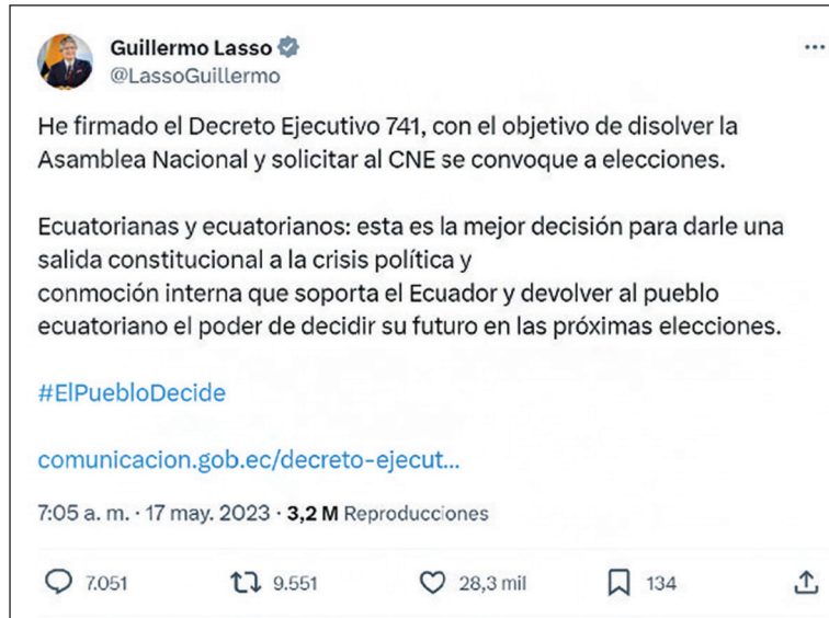
Figura 4. Temas principales utilizados como hilo argumental (variable "tipo de lenguaje")