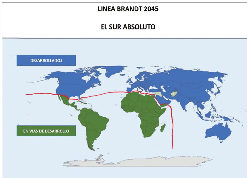
Mapa 2. Hipótesis del Sur absoluto

Si América Latina y África, que no aparecen en el ejercicio anterior, mantienen su actual situación económica, o sea, siguen sustentando su crecimiento en la exportación de recursos naturales y productos de bajísimo valor agregado, evidentemente continuarán con su calidad actual de integrantes del Sur, solo que ahora sin Asia, que habrá pasado al mundo desarrollado. Esto implicaría un radical desplazamiento de la Línea Brandt en un sentido que va del Noreste al Suroeste, en donde América Latina y África se habrían transformado en una suerte de “Sur absoluto” (mapa 2). O sea, serán regiones en permanente estado de subdesarrollo o “en vías de desarrollo”, además de periféricas y subordinadas a los nuevos mega poderes que serán el núcleo del orden multipolar.