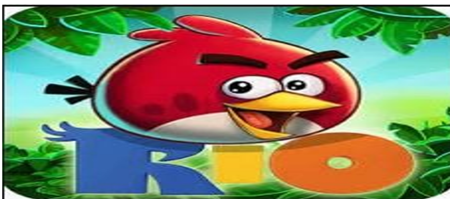
FIGURA 1 Aplicativo Angry Birds Rio Fonte: Angry Birds Rio (2016).

Neste aplicativo, trata-se de um grupo de pássaros, que ficam furiosos após serem capturados e enviados por contrabandistas ao Brasil. Ao chegarem, encontram outras aves presas em gaiolas, em meio a caixas, correntes, vidro, concreto, madeira e outros materiais. Em cada fase do aplicativo, os pássaros furiosos, usando um estilingue, se lançam nessas estruturas na tentativa de destruí-las, e, assim, salvar as outras aves. A escolha pelo aplicativo se deu por atender às necessidades conceituais e de contextualização dos conteúdos matemáticos, com características e potencial para funcionar como interface facilitadora da aprendizagem, ao mesmo tempo em que proporcionasse diversão e entretenimento.