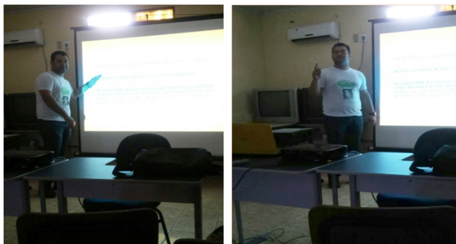
Figura 3 Professor regente atuando em aula

Nesse sentido observa-se (Figura 3) uma grande interação na concepção que diz respeito professor/aluno e aluno/professor, valorando o sentido dos saberes conforme Paulo Freire (2011, p.68) “não há saber mais, nem saber menos, há saberes diferentes”.