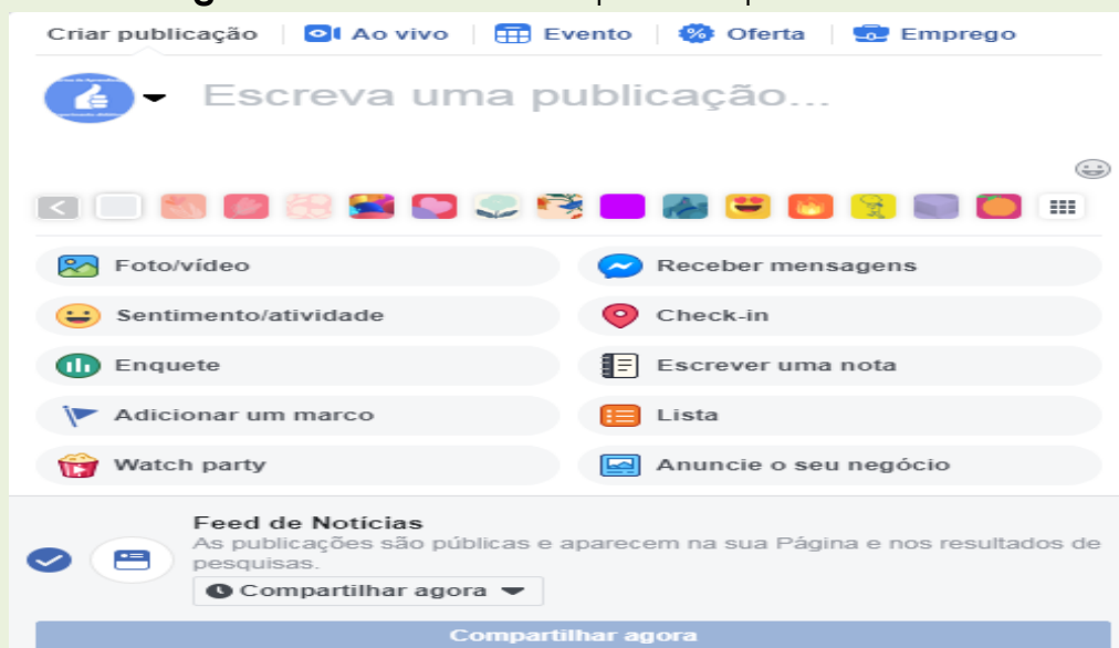
Figura 02: Print screen capturado pelos autores