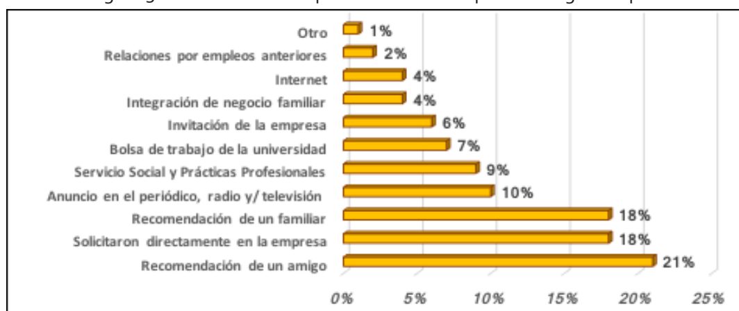
Figura 3. Medios utilizados por los contadores para conseguir empleo