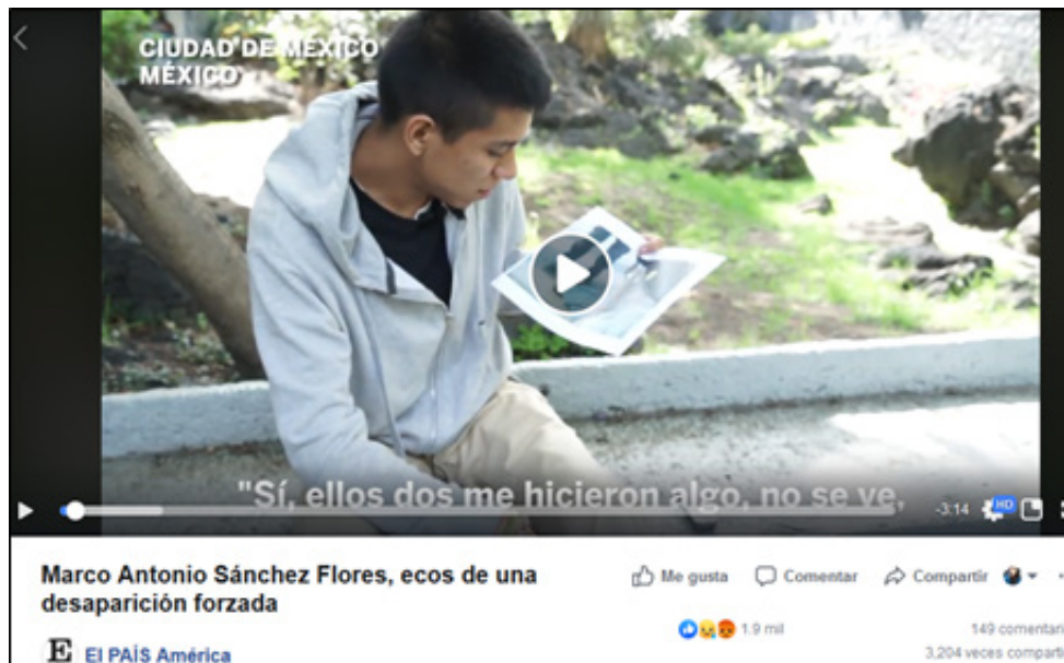
Imagen 1. Ejemplo del reactivo 25 en el cuestionario