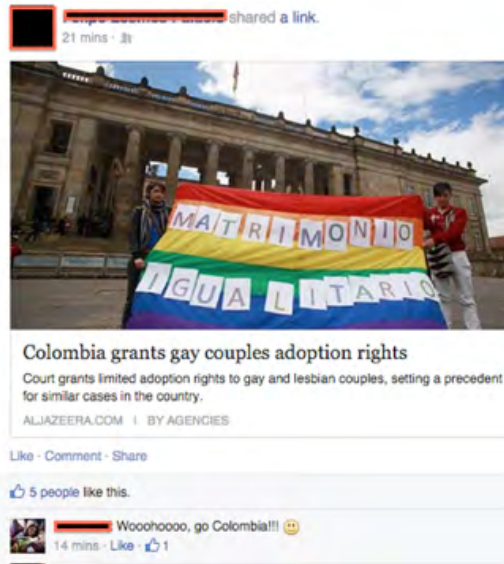
Figura 4 Betancourt celebra una victoria para las minorías sexuales en Colombia