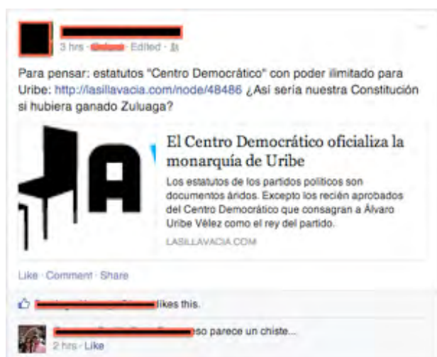
Figura 1 Repost de La silla vacía. Captura de pantalla de Facebook de un informante

lejos [...] es muy difícil formar una opinión política, por lo que es muy importante escudriñar sus currículos, ¿qué han hecho por el país?”. Por ejemplo, Betancourt, para las elecciones legislativas anteriores, utilizó una herramienta que se puso a disposición con el apoyo de una de las universidades de Colombia en alianza con Congresovisible.org , un sitio web dedicado a almacenar información y proporcionar información política. Se trataba de un análisis para cualquier persona interesada en ejercer control político: “La herramienta era como una encuesta, que tenía preguntas sobre temas políticos [...], como las políticas de drogas, los derechos LGBTI, el aborto, otros temas críticos [...]; dependiendo de su respuesta, mostraba una nota diciendo ‘Según sus preferencias, su candidato debe ser X o Y’” (Entrevista personal).