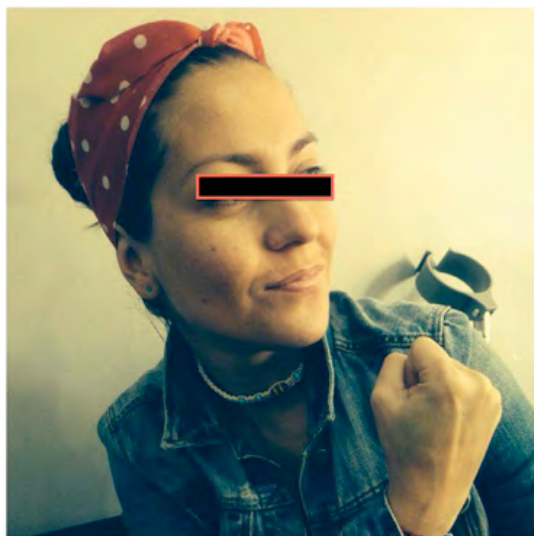
Figura 3 Gabriela personifica a su ídolo, Rosie la Remachadora

Es evidente que los perfiles públicos están estrechamente conectados con las vidas diarias, en las que las entrevistadas se presentan como mujeres migrantes. Varios autores explican que cuando un rol se internaliza, la identificación se produce, y que las identidades se hacen evidentes por medio de comportamientos (Stryker y Serpe, 1994; Stryker, 2000; Stryker y Burke, 2000). En este particular, las identidades se presentan mediante sus perfiles y mensajes.