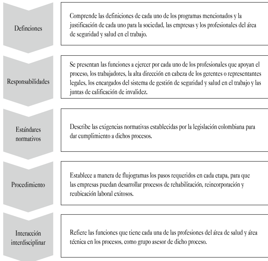
Figura 2. Contenido de la guía “De regreso al trabajo”

El análisis de la información recopilada nos lleva a establecer una herramienta didáctica que permita mejorar la comprensión y aplicación por parte de las empresas del programa de reubicación y readaptación laboral, facilitando así el reintegro efectivo de trabajadores que presentan restricciones médico-laborales, temporales o definitivas, generando a futuro casos exitosos, que permitan a estos individuos mantener su rol productivo en la sociedad. Para ello, se diseñó la guía didáctica “De regreso al trabajo”, que responde a las necesidades evidenciadas en la investigación y que consta de cinco capítulos, que se presentan en la Figura 2.