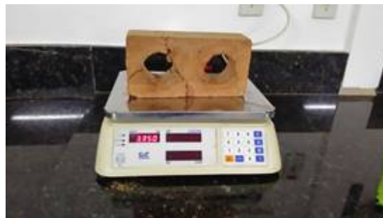
Figura 13- Molde Tijolo 3 M 1 .

Pode ser visto na figura 12 e 13 que alguns tijolo trincaram durante o processo de fabricação, podendo estar relacionado com a alteração da resistência causado pela adição da fibra vegetal.