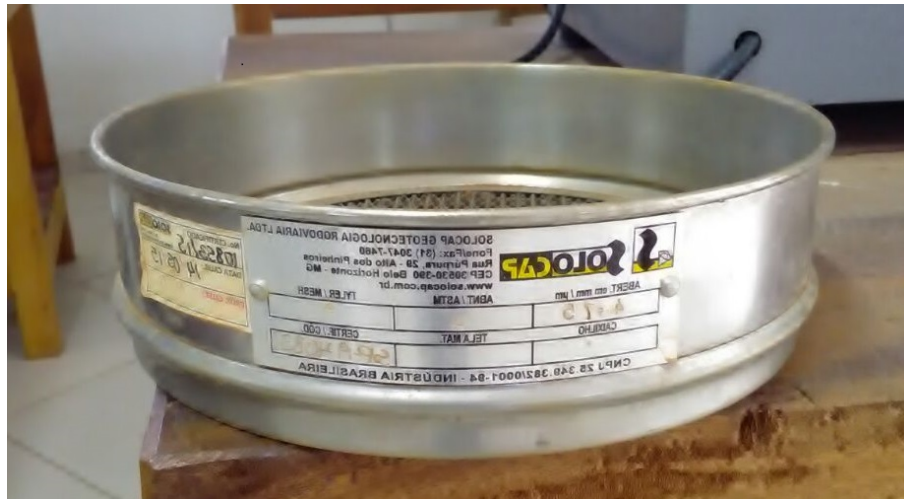
Figura 3- Peneira.