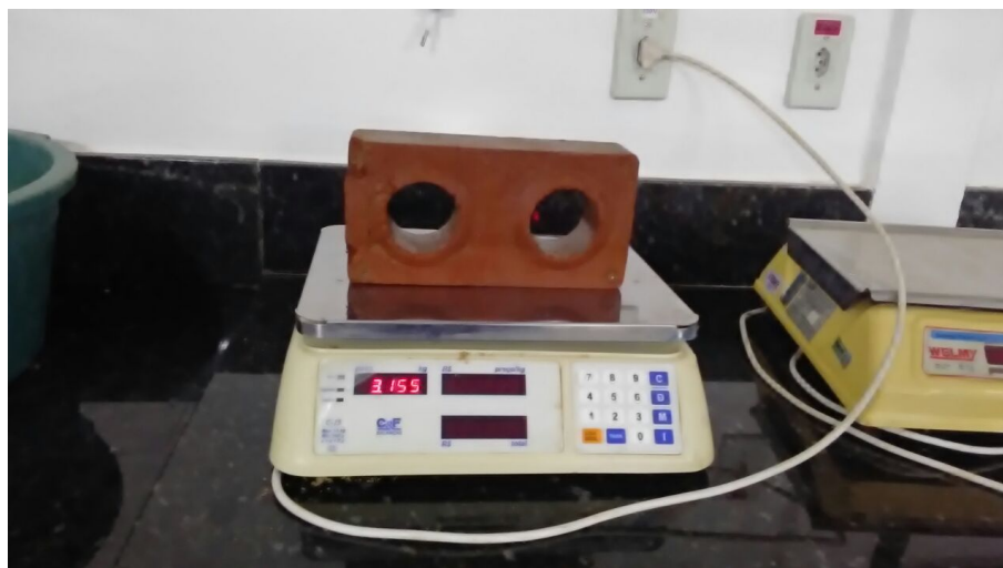
Figura 8- Molde Tijolo 1 M 2 .