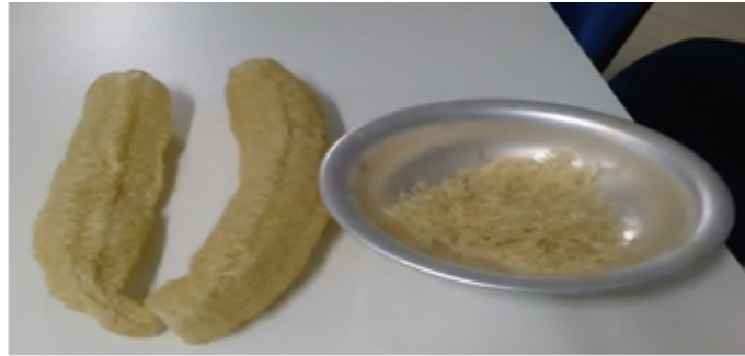
Figura 1- Bucha vegetal.

Como mostrado na figura 1, fibra vegetal produto de origem natural, é tido como um produto sustentável e de baixo custo, podendo ser acrescentar no tijolo, obtendo ótimos resultados aos seus compósitos pelos seus inúmeros benefícios.