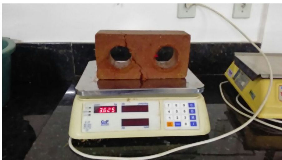
Figura 9- Molde Tijolo 2 M 2

Após o processo de umidificação em imersão em água, os tijolos são retirados e pesados afim de verificar e quantidade de água que ele absorveu, para poder medir a porosidade do material com base na quantidade de água que ele absorveu.