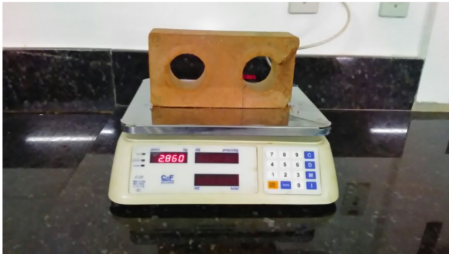
Figura 11- Molde Tijolo 1 M 1 .

Nas figuras 10 e 11, pode ser visto os tijolos solo cimento feitos com diferentes quantidade de bucha vegetal, implicando em colorações diferentes, visto a redução da matéria primo do solo presente.