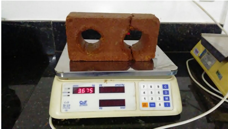
Figura 10- Molde Tijolo 3 M 2 .