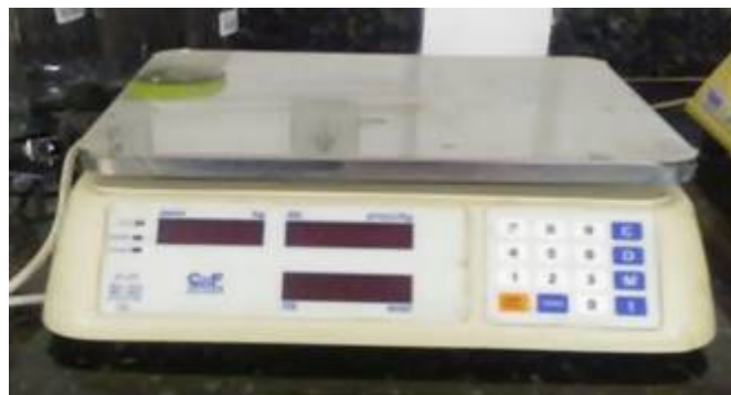
Figura 4- Balança.

O peneiramento ilustrado na figura 3, representa uma etapa de separação dos grãos de acordo com a gramatura, na qual a passagem pela peneira padroniza o tamanho do grão, mantendo propriedades mecânica e homogeneidade na estrutura.