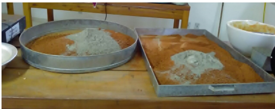
Figura 5- Mistura da composição solo-cimento.

Após a fabricação dos tijolos, foi deixado dentro de sacolas coberto por areia úmida, para evitar de ser umedecidos diariamente, após sete dia eles foram umedecidos e com 14 foi feito o processo da resistência a compressão.