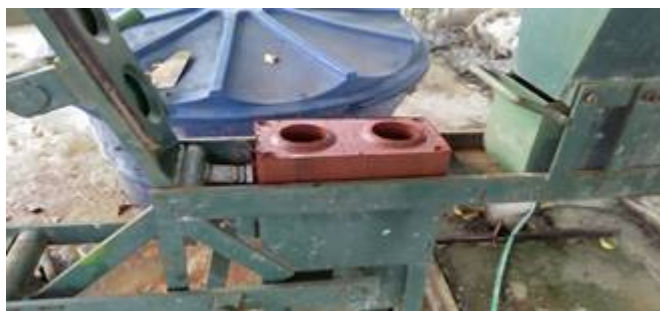
Figura 6 - Prensa manual.

O processo de mistura vai colocar na prática todos os cálculos feitos, na qual será visto se a adição dos materiais citados fizeram ou farão alguma alteração na aplicação do tijolo. Como mostrado na figura 5, a mistura é feita em bacias e formas de alumínio.